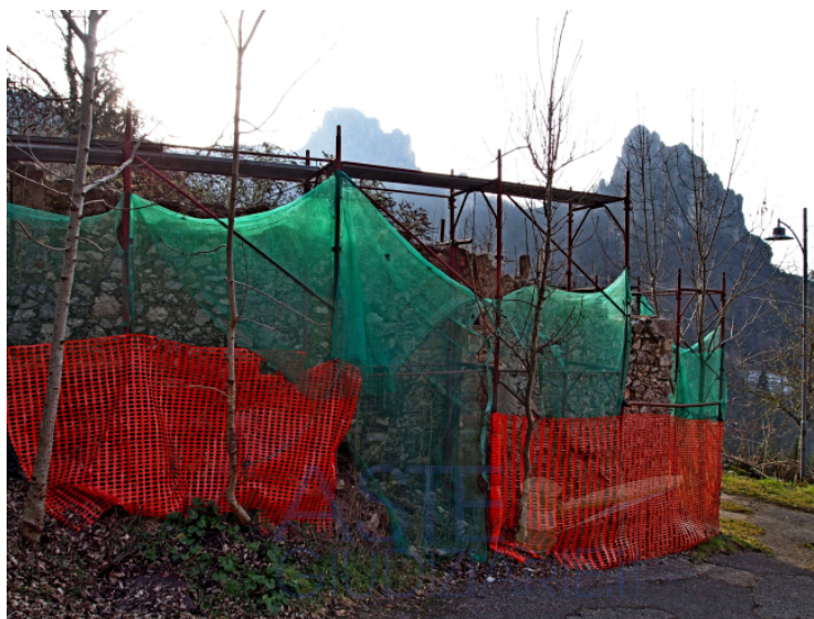
RUDERI RUSTICO DA NORD