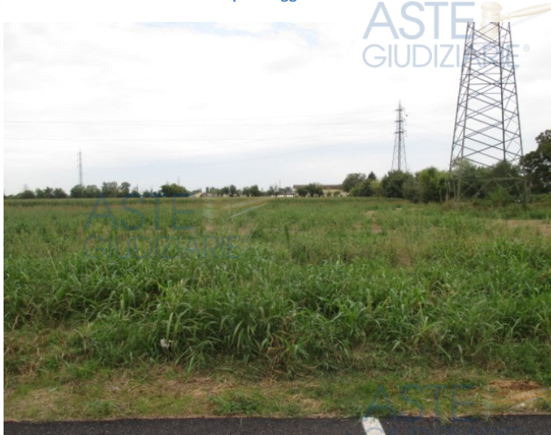
Fronte su via Bezzecca