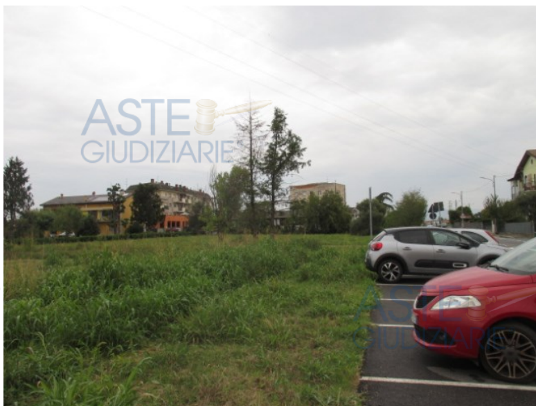
vista da sud verso Nord