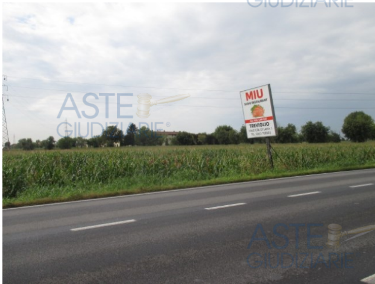
vista da via Milano