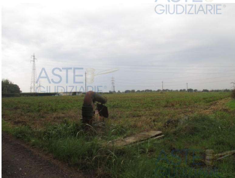
Vista da strada sterrata che si dirama da via Cascia Pallavicina