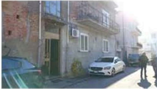
Prospetto dalla via pubblica