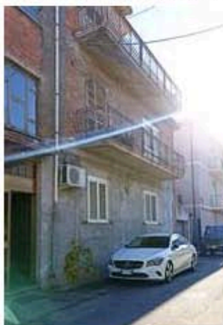
Prospetto sulla via pubblica

L'intero edificio sviluppa 3 piani fuori terra. L'immobile è stato costruito nel 1968.