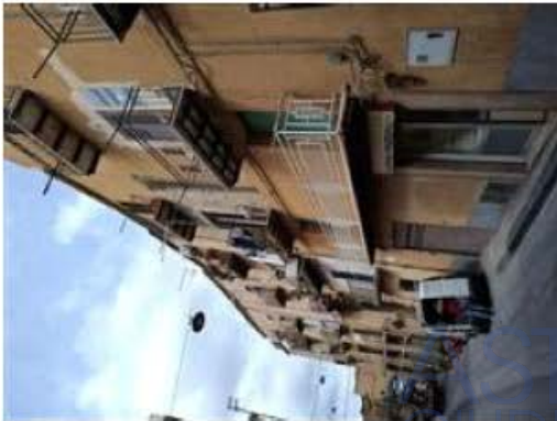
fabbricato prospetto via Garibaldi

il bene è ubicato in zona centrale (centro storico) in un'area residenziale, le zone limitrofe si trovano in un'area commerciale. Il traffico nella zona è locale, i parcheggi sono scarsi. Sono inoltre presenti i servizi di urbanizzazione primaria e secondaria, le seguenti attrazioni storico paesaggistiche: Valle dei templi di Agrigento.