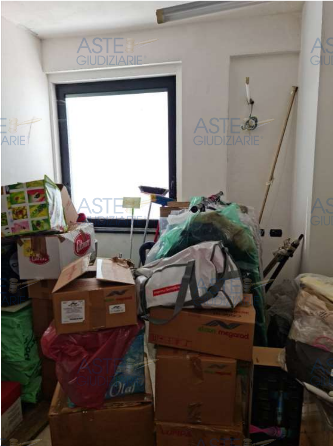
Veduta della camera da letto dell'appartamento in sub 14