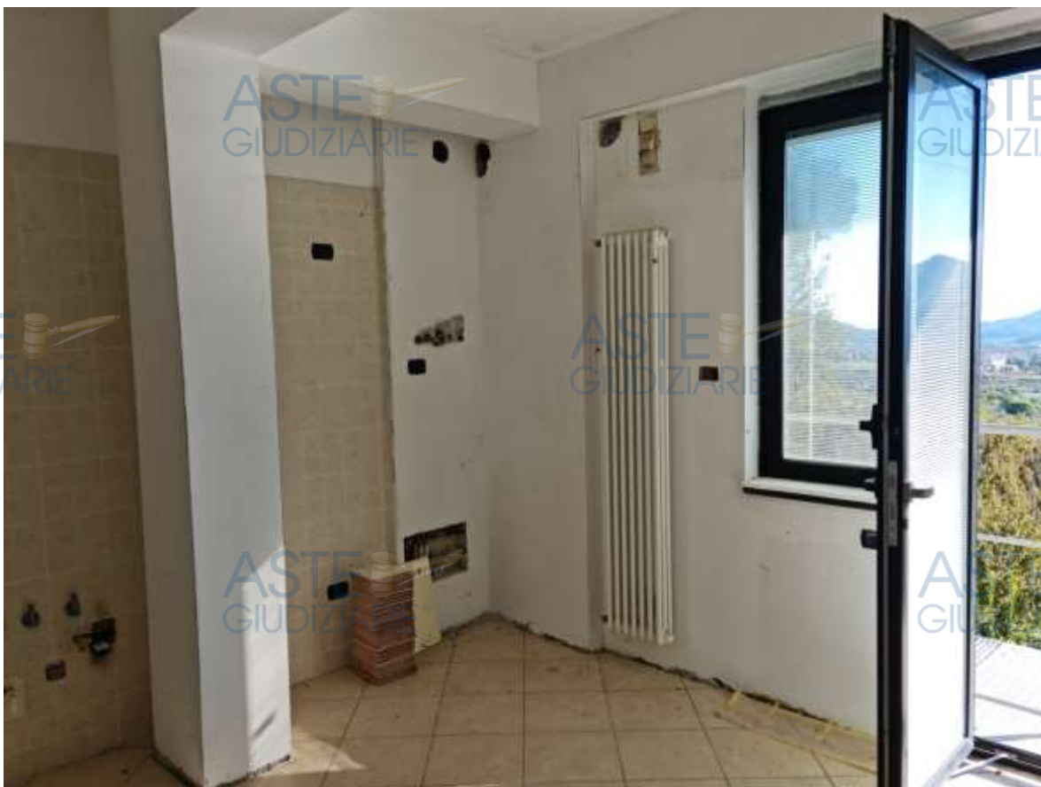
Veduta della cucina/soggiorno dell'appartamento in sub 16