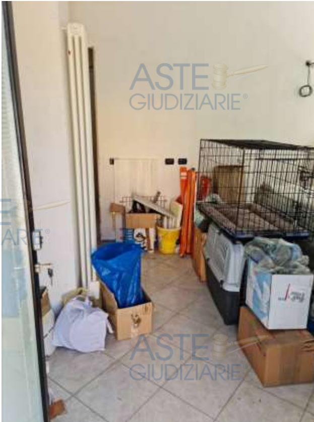
Veduta del soggiorno/cucina dell'appartamento in sub 14