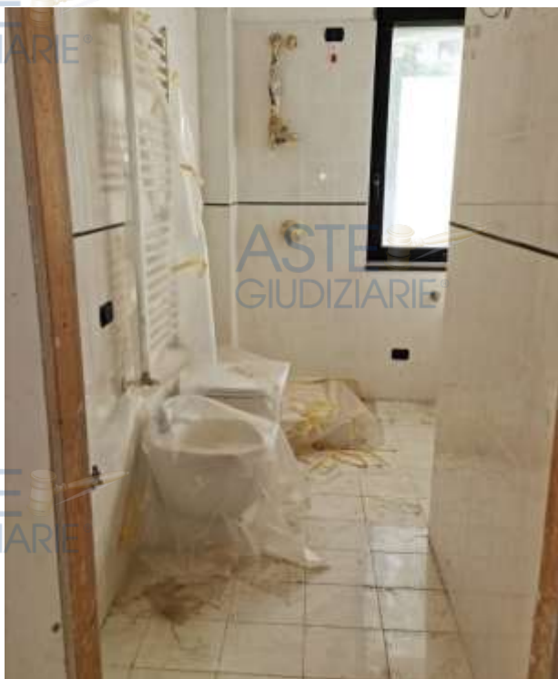
Veduta del bagno