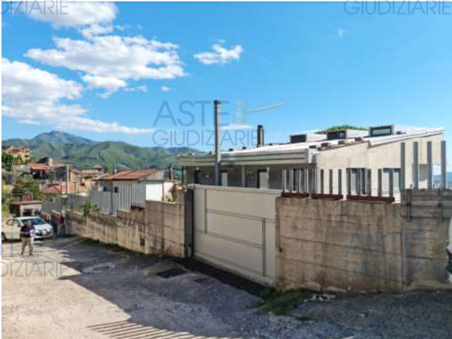
Cancello d'ingresso carrabile e pedonale, lato nord.