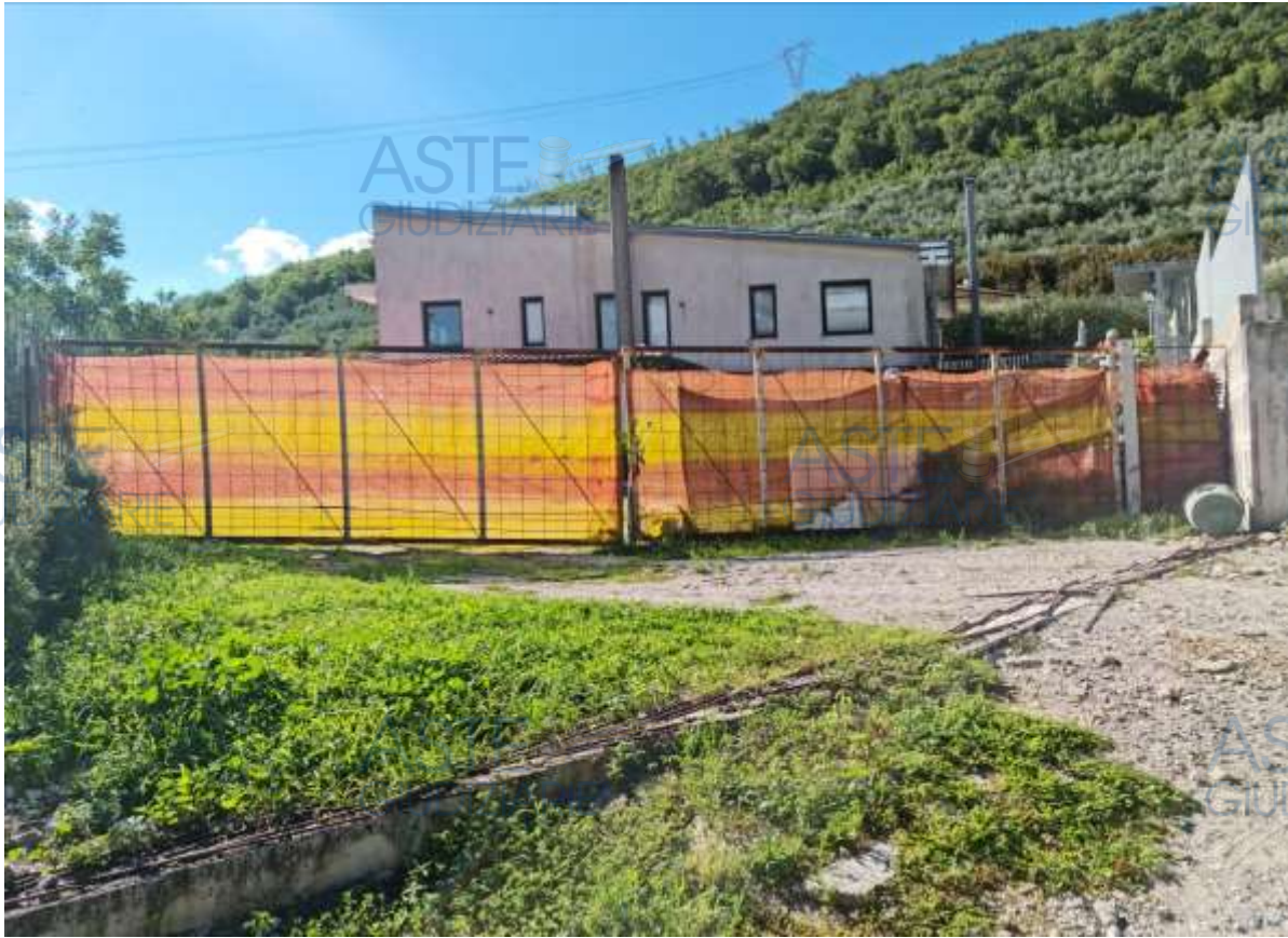
Cancello d'ingresso carrabile ad est, attualmente ancora cantierato.