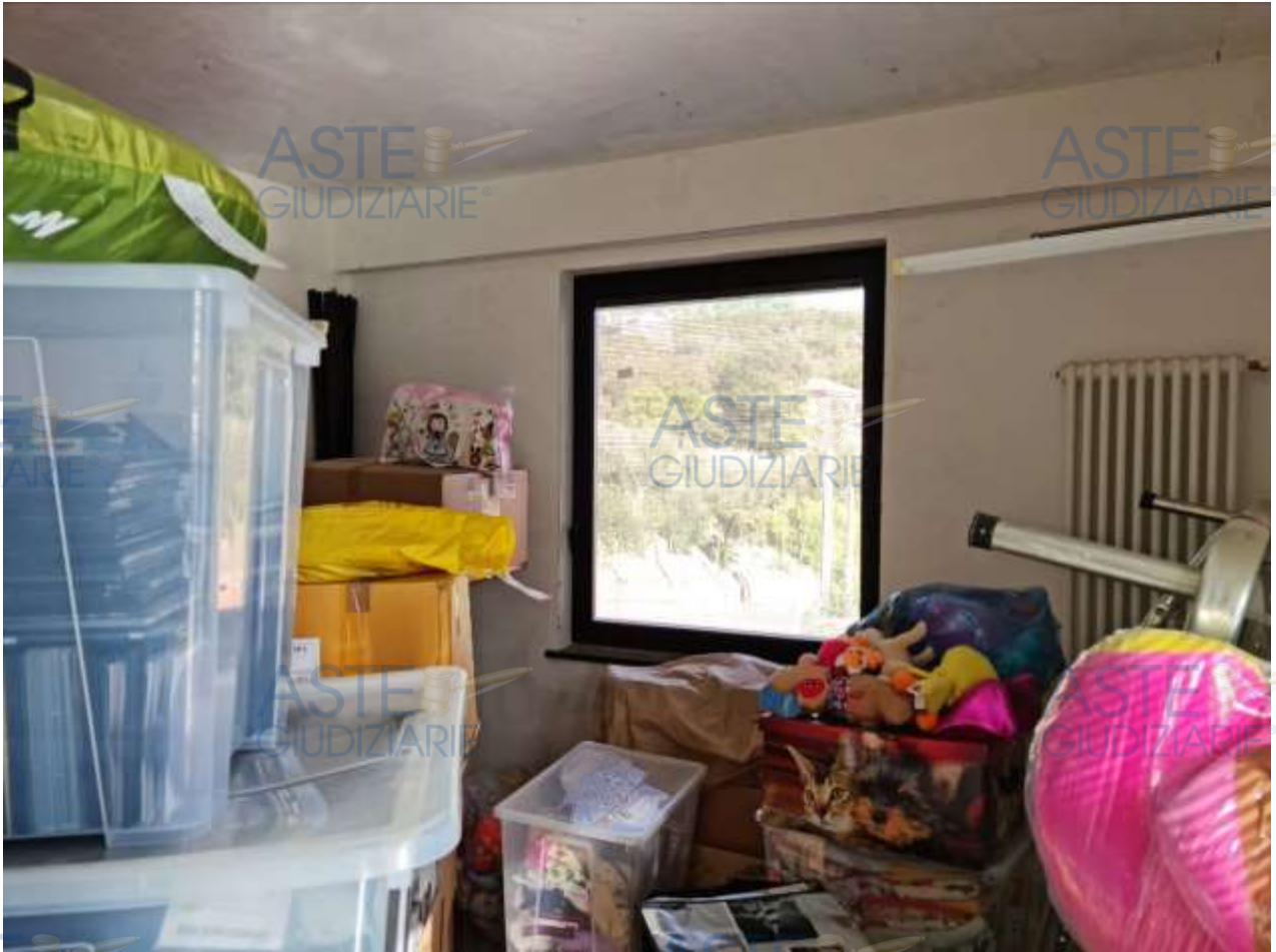
Veduta del soggiorno/cucina dell'appartamenti in sub 17