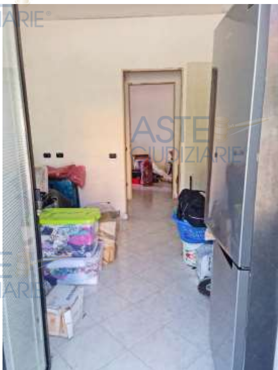
Veduta dell'ingresso su soggiorno/cucina del sub 15