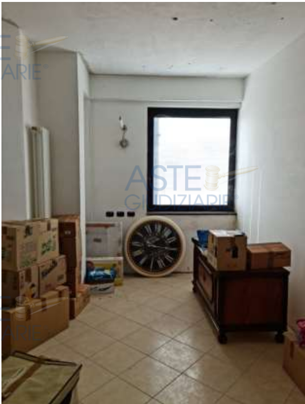
Vedute della camera da letto