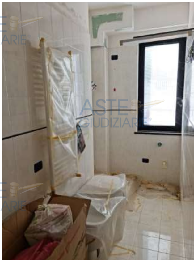
Veduta del bagno dell'appartamento in sub 14