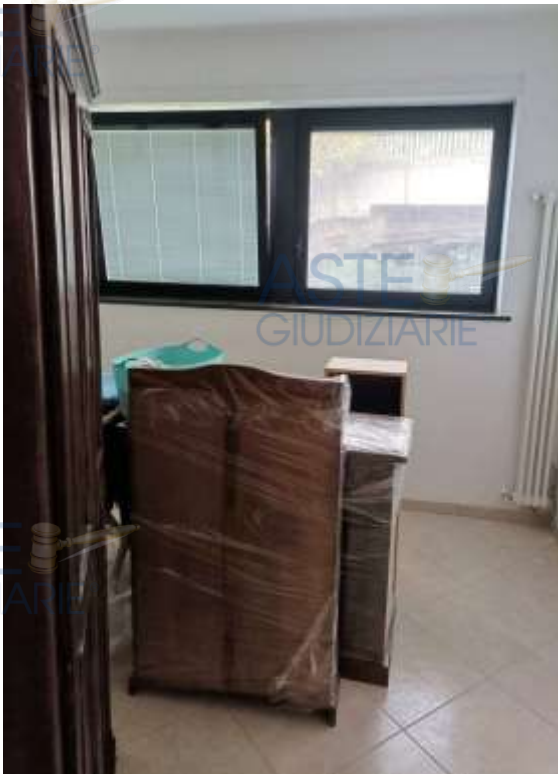
Veduta della camera da letto appartamento in sub 11