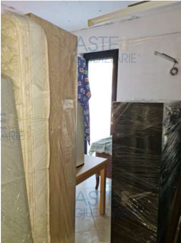
Veduta della camera da letto