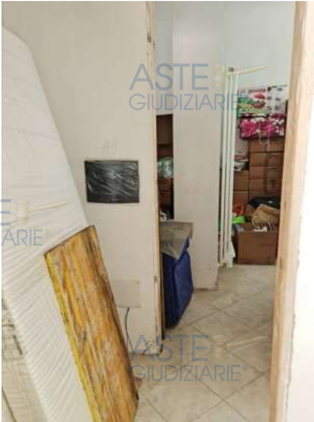
Veduta del disimpegno dell'appartamento in sub 14