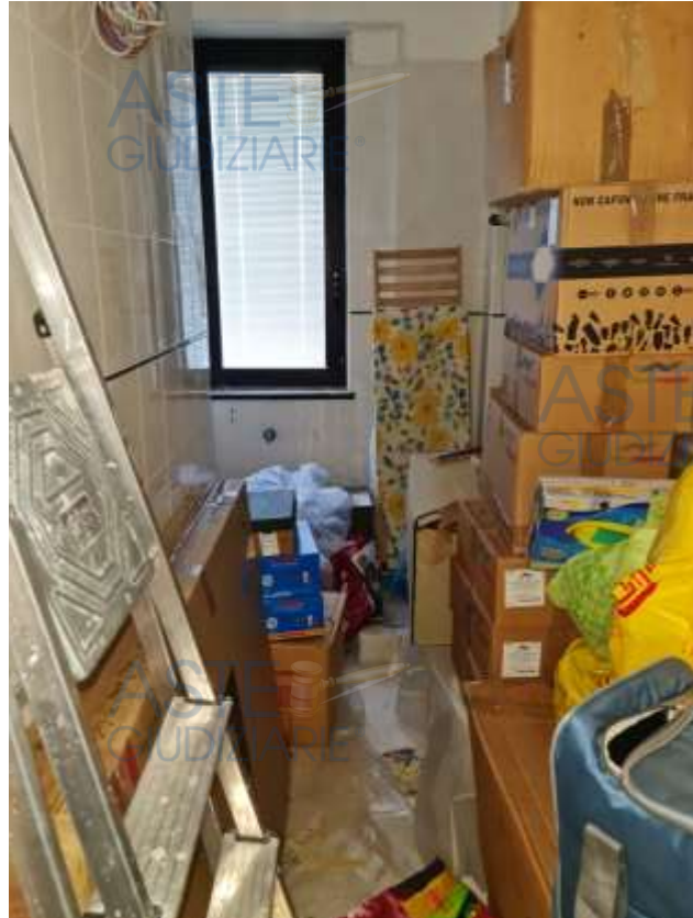
Veduta del bagno