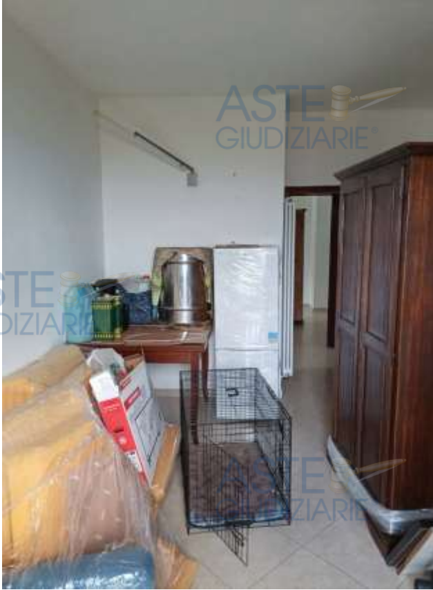
Veduta del soggiorno/cucina appartamento in sub 11