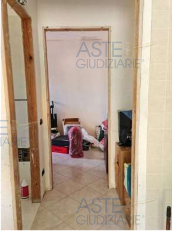
Veduta del disimpegno del sub 15