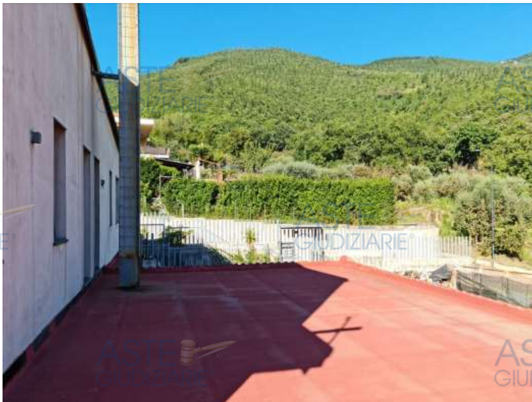
Veduta dei lastrici solari in sub 12 e 13, mediante i quali si accede al ballatoio d'accesso agli appartamenti in sub 17 e sub 16 e relativo ballatoio in struttura metallica