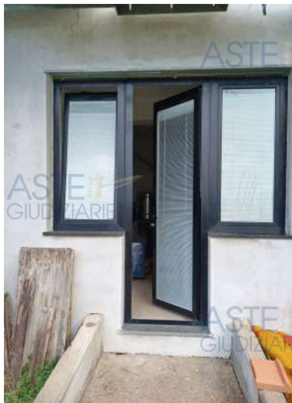
Vedute sull'ingresso all'appartamento in sub 11 e sulla corte in sub 24