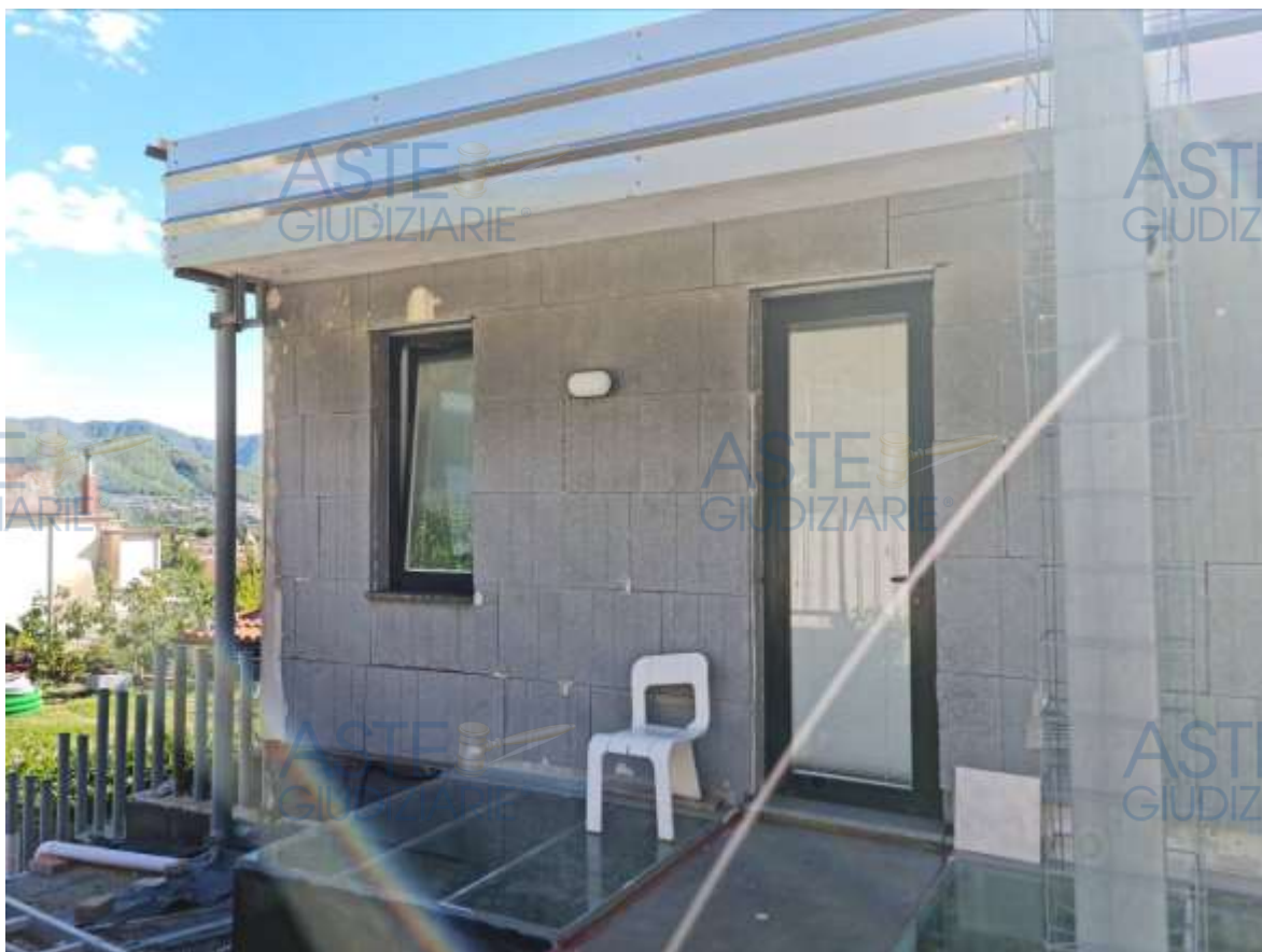
Veduta dell'attuale accesso esterno all'appartamento in sub 15