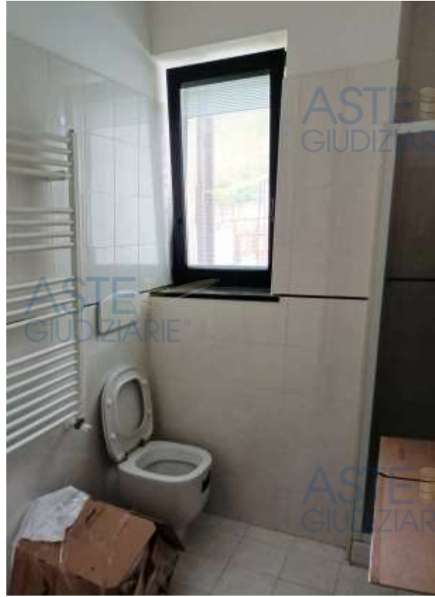
Veduta del bagno appartamento in sub 11