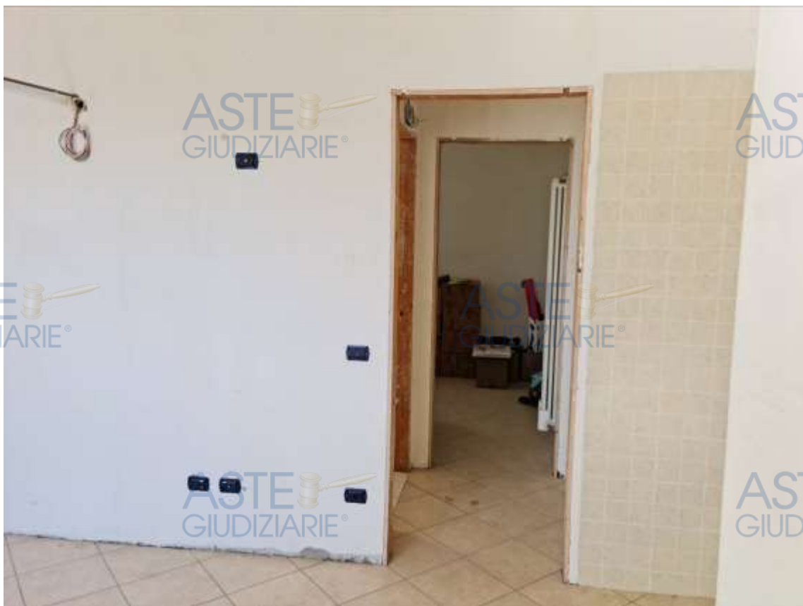
Veduta dalla cucina/soggiorno verso il disimpegno e la camera da letto