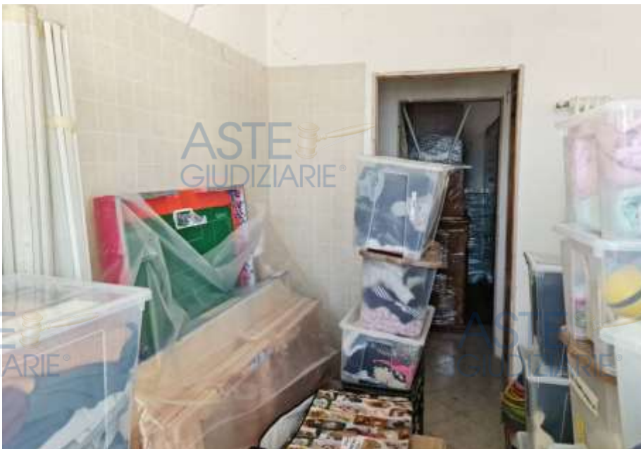
Veduta dal soggiorno/cucina verso il disimpegno e la camera da letto