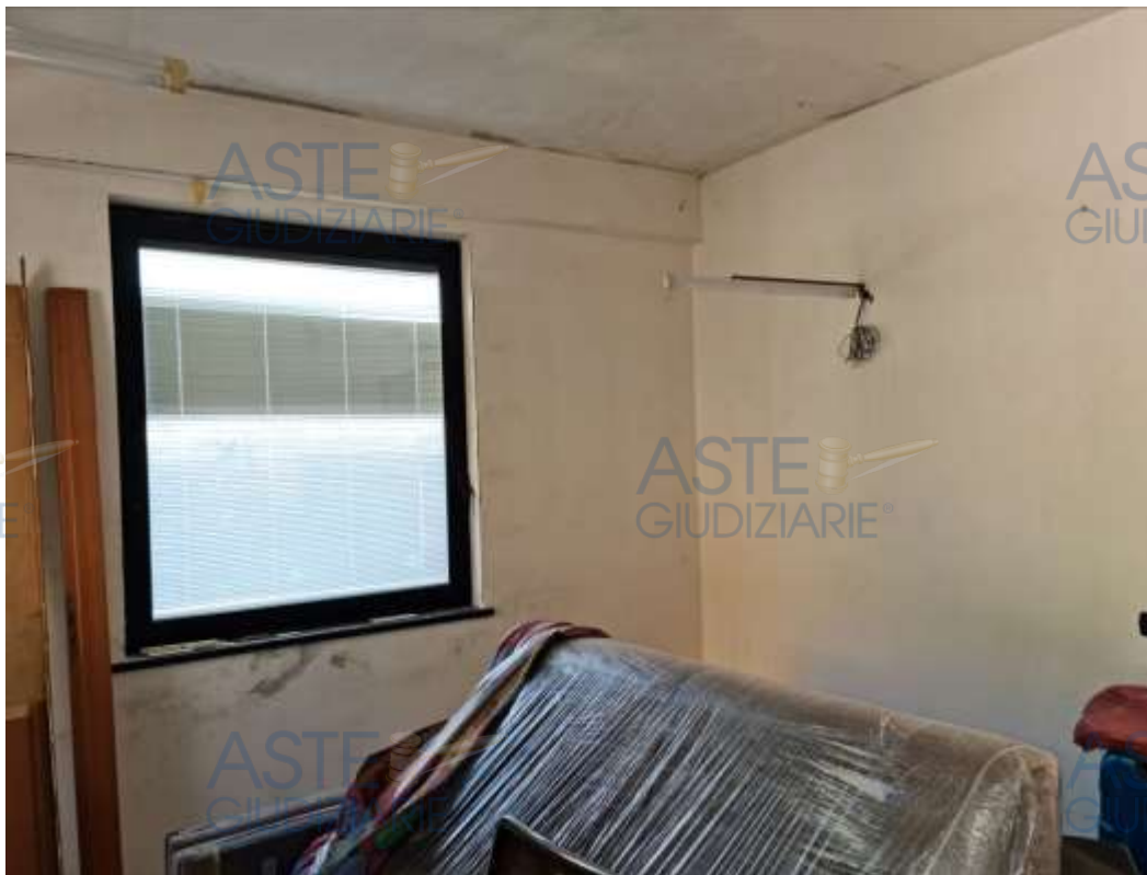
Veduta del soggiorno/cucina del sub 15