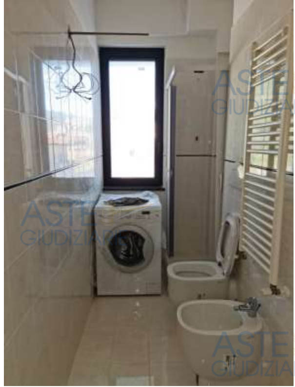
Veduta del bagno del sub 15