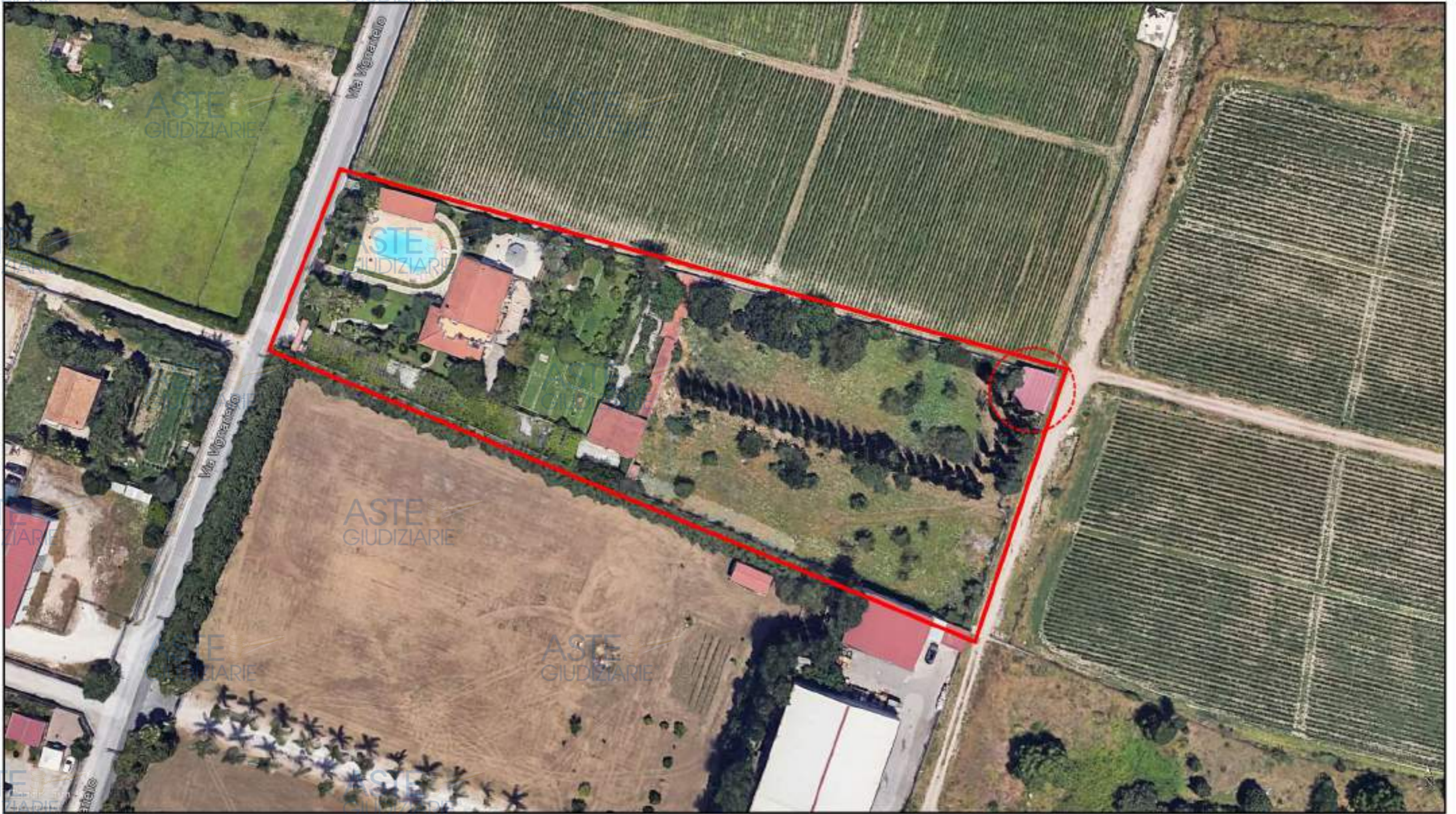
Ortofoto dei luoghi (in evidenza il compendio immobiliare pignorato e l'ubicazione dell'unità immobiliare in oggetto)