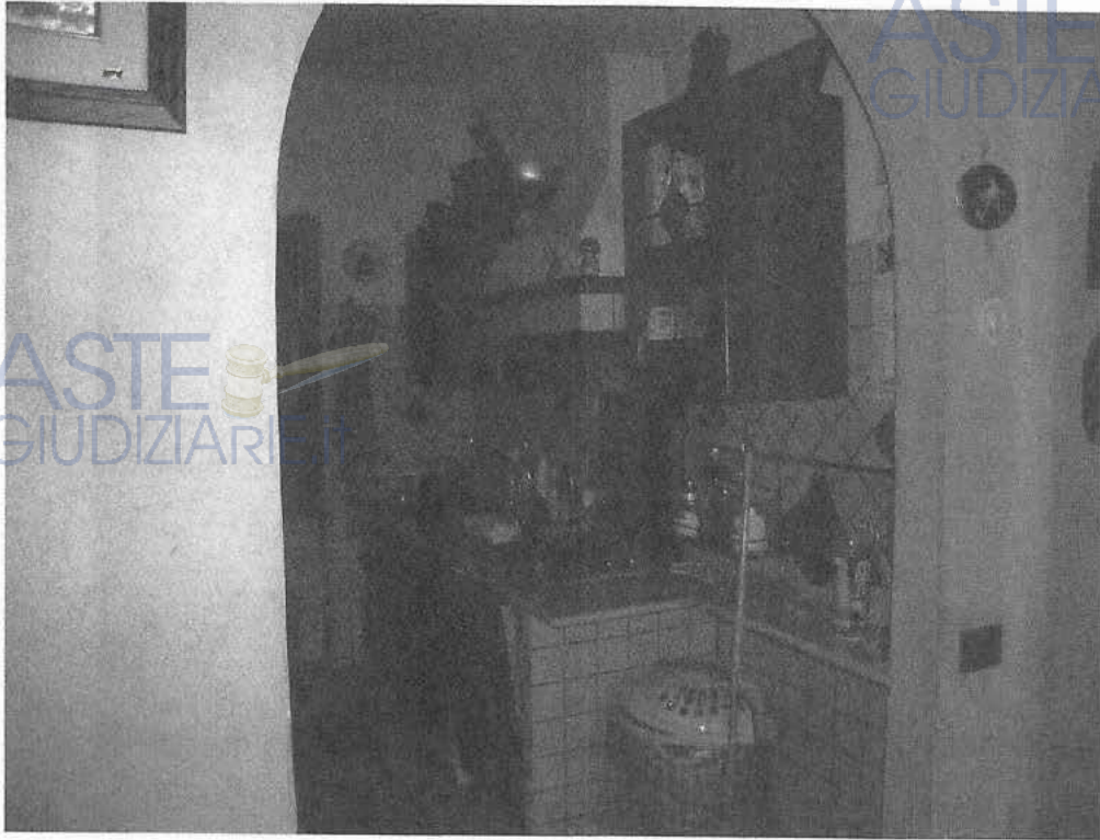
FOTO DELLE CAMERE