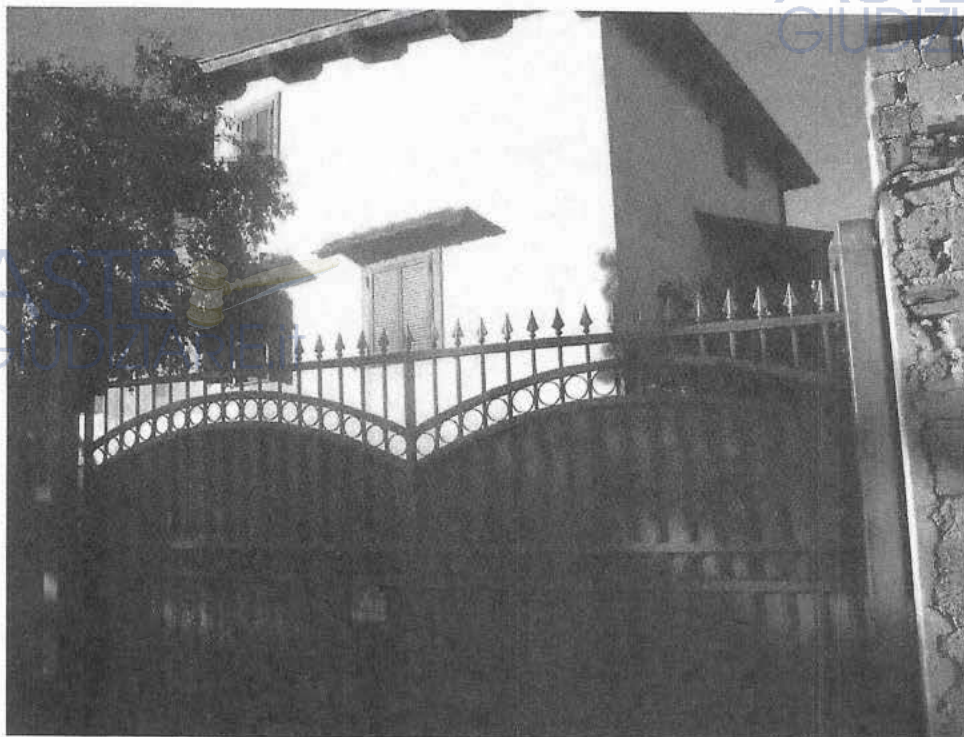
FOTO PRINCIPALE DEL PORTICO ED INGRESSO ABITAZIONE