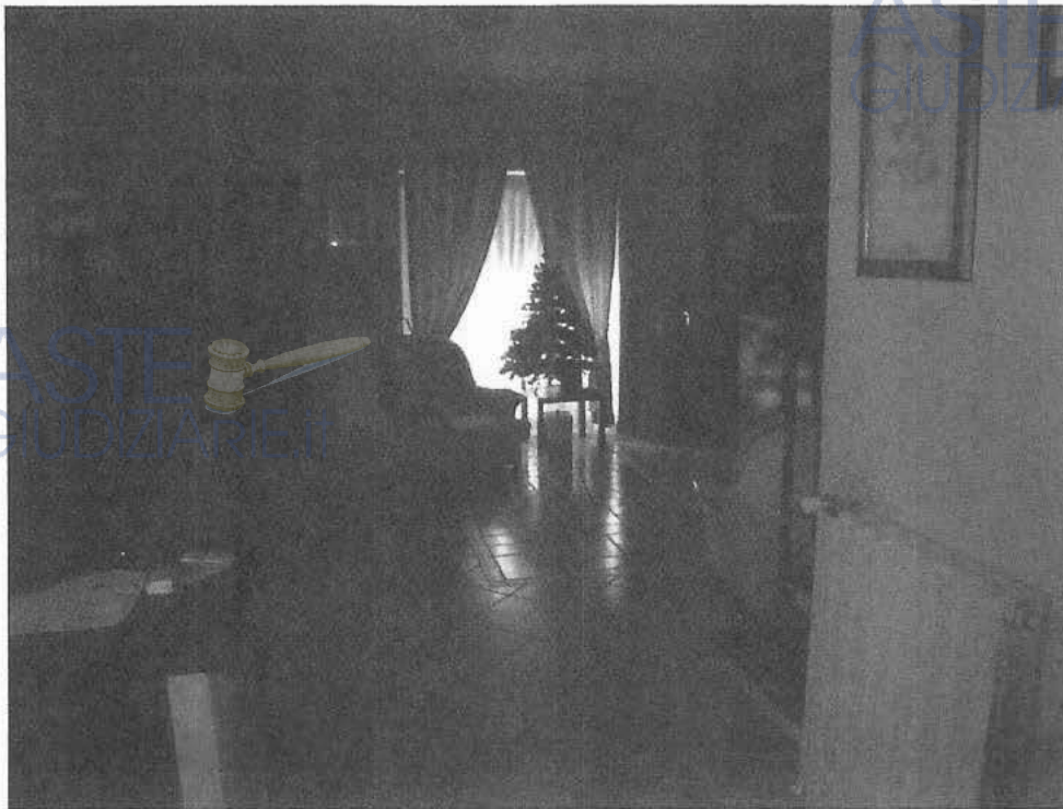
FOTO INTERNE DELLA CAMERA