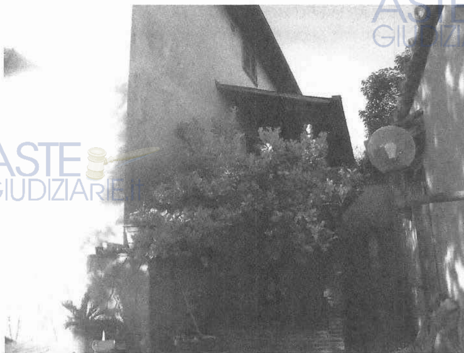
FOTO ESTERNE DEL MAGAZZINO E GARAGE