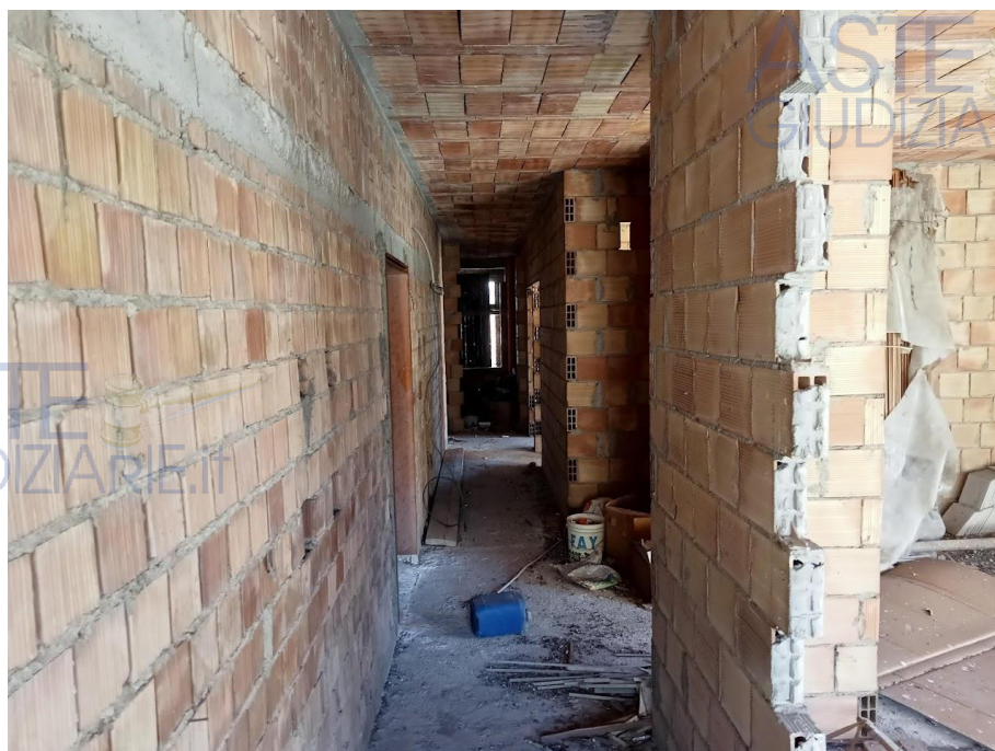
Foto n° 10 di 17 LOTTO n° 6 – Unità in corso di definizione (Locale sottotetto)