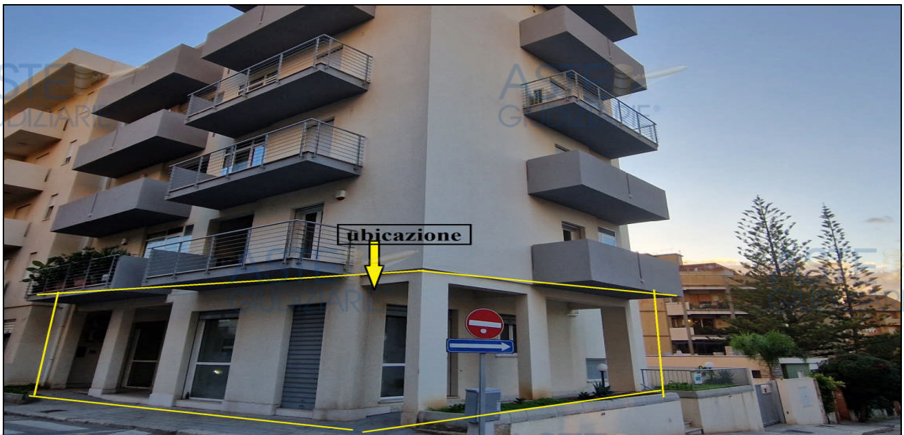
FIGURA 3: PANORAMICA STATO DEI LUOGHI - LOCALE COMMERCIALE

L'edificio di cui fa parte il locale in questione, costruito nel 2013, di cinque elevazioni f.t. oltre il piano seminterrato, disposto ad angolo e con accesso diretto sulla via Cosenza e la via Ravenna, comprende al piano seminterrato otto locali di sgombero, al piano terra un locale commerciale ed un androne (con vano scala e ascensore) ed ai piani soprastanti, sette appartamenti destinati a civile abitazione, oltre una retrostante area vincolata a parcheggio condominiale. L'intero edificio è stato realizzato con struttura intelaiata con travi e pilastri in c.a., fondazioni con travi e cordoli in c.a., tompagnatura e tramezzatura in conci e segati di tufo, solai in latero cemento, copertura a terrazzo e prospetto esterno rifinito con intonaco plastico con effetto striato e zocchetto in marmo (allegato n. 4 foto n. 1-2-3-4).