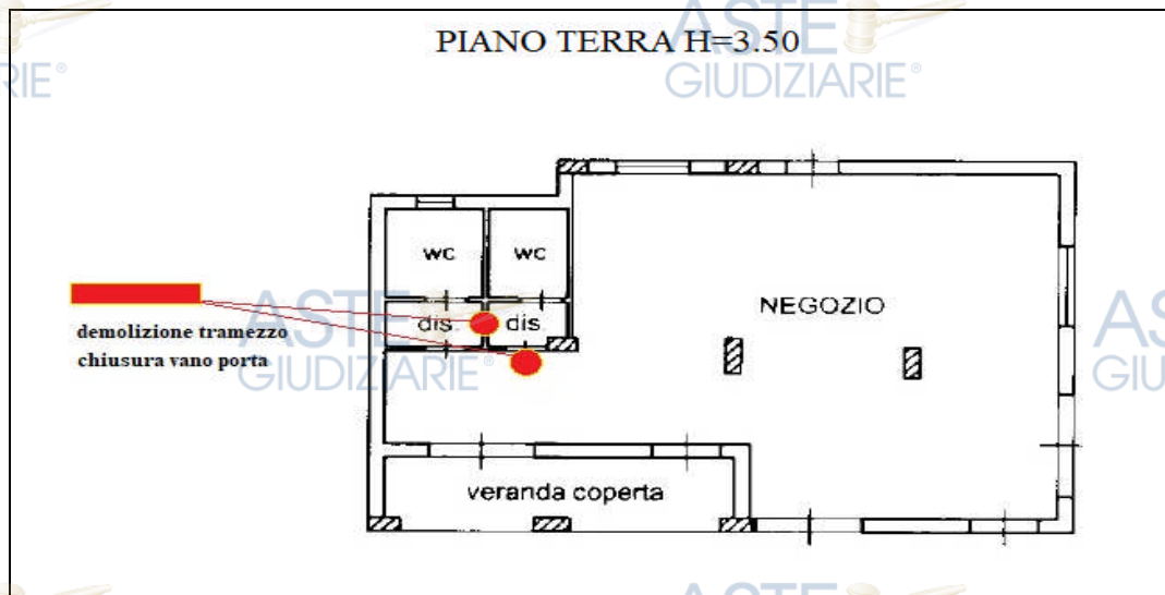
FIGURA 1: RAPPRESENTAZIONE DELLE DIFFORMITÀ SULLA PLANIMETRIA CATASTALE