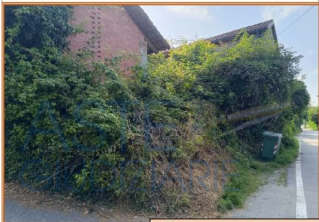
Vista esterna dell'immobile nel 2024

Durante il sopralluogo esperito nel 2024 ( tre anni dopo ), i luoghi risulta-