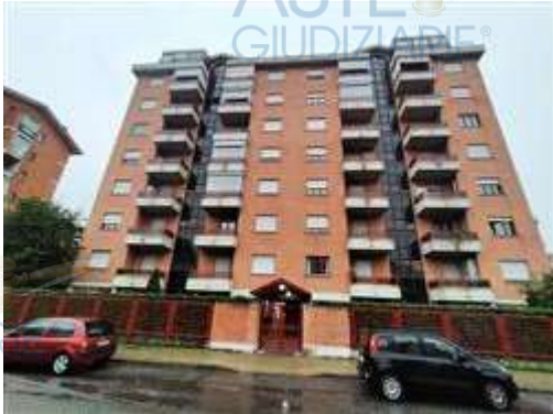
Vista dell'edificio condominiale di via staffette partigiane

L'intero edificio sviluppa 10 piani, 9 piani fuori terra, 1 piano interrato. Immobile costruito nel 1995.