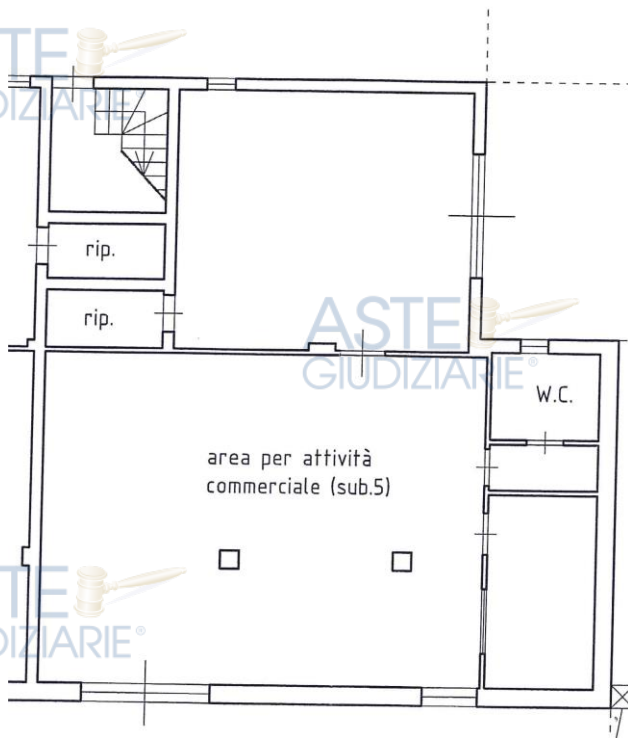
Fig. 1 : "Planimetria allegata alla pratica Prot. N. 13016 del 17.06.2009"

Per una migliore comprensione si riportano di seguito la planimetria dello stato attuale dell'immobile, piano terra, e la planimetria allegata alla pratica di opere interne del 17/06/2009 Prot. n. 13016 a confronto, e che risultano perfettamente coincidenti: