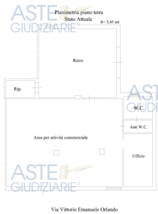
Fig. 2 : "Planimetria stato attuale"