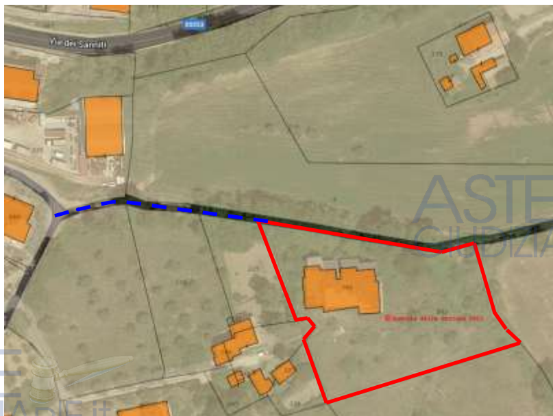
Figura – In blu tratto di accesso al lotto, attualmente difficilmente percorribile

Si precisa che il fabbricato in corso di costruzione (P.lla 283) è raggiungibile dalla viabilità principale solo attraversando la porzione di area P.lla 282, la quale non ha accesso diretto, se non, tramite "sentiero/strada interpoderale", attualmente di difficile percorribilità al confine con la P.lla 6 a nord.