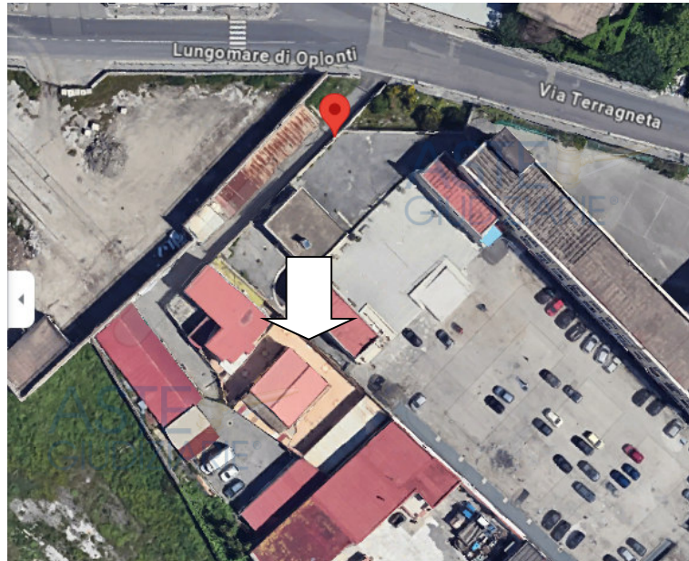
Fig.1 - Vista dell'immobile e del suo intorno

Le due unità edilizie oggetto di pignoramento immobiliare come innanzi descritte, sono ubicate nella zona a valle del comune di Torre Annunziata, ovvero quasi a ridosso della zona portuale alla quale si giunge percorrendo la via Terragneta.