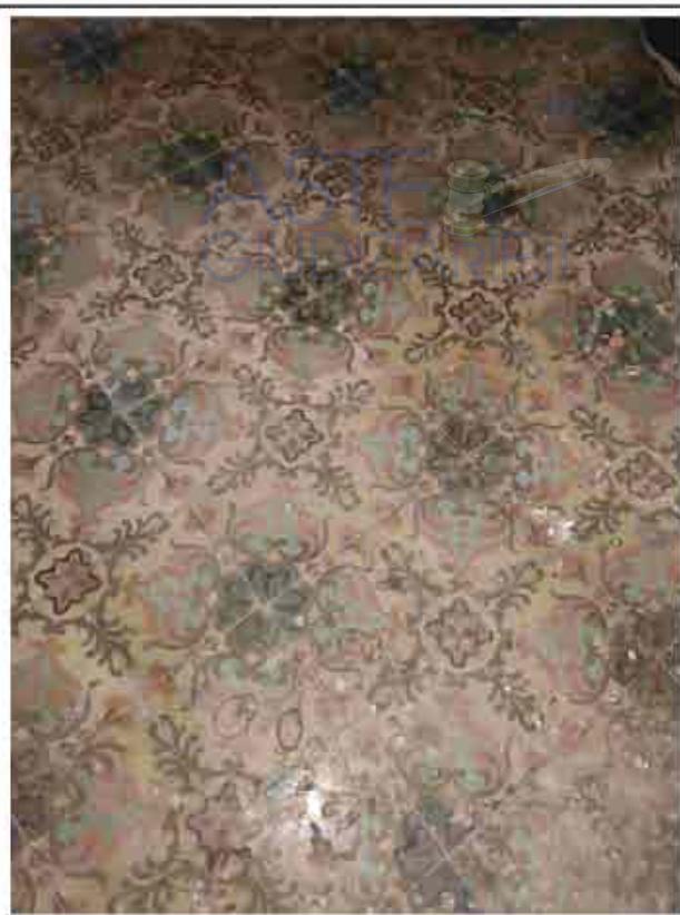
18. Primo Piano - Tipologia Pavimentazione