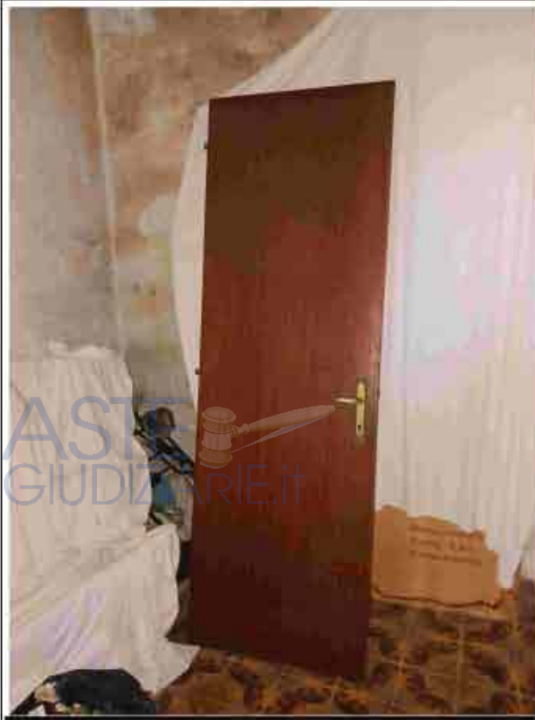
21. Primo Piano – Depositi di materiali