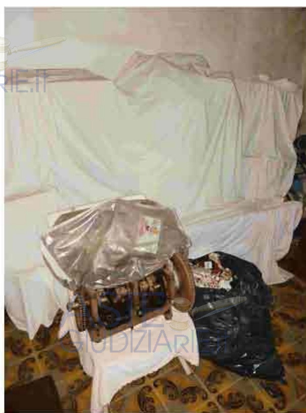
20. Primo Piano - Depositi di materiali