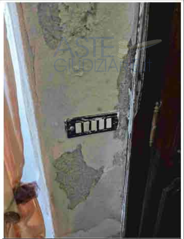
10. PT - Dettaglio impianto elettrico