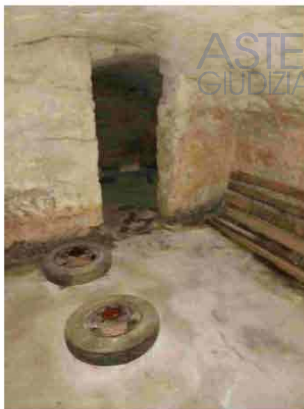
31. Piano interrato - cantina