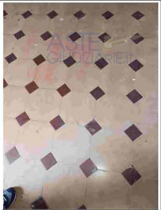
38. Tipologia pavimentazione