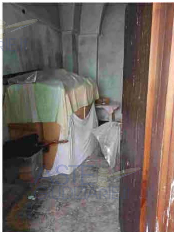
16. Primo Piano – Camera da letto