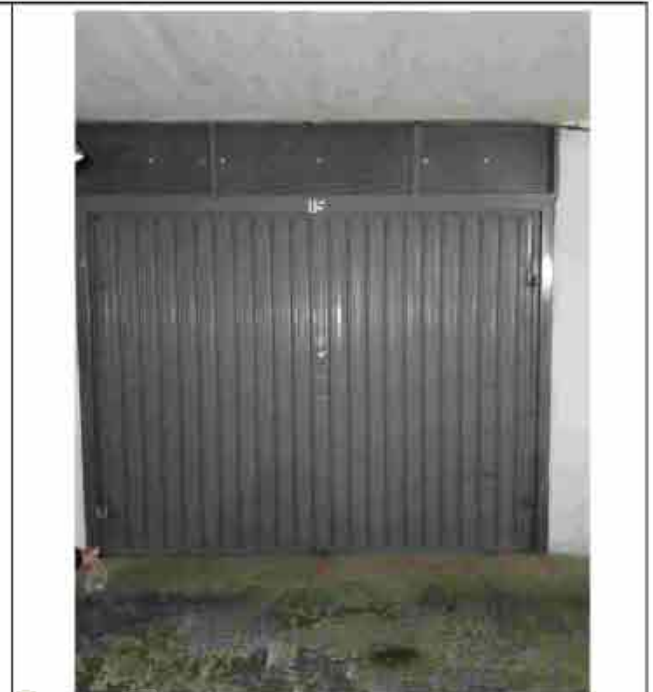
42. Box auto