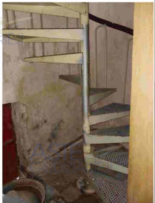
12. PT - Scala a chiocciola