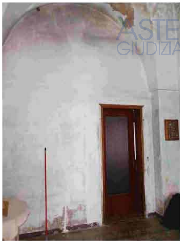
15. Primo Piano - Soggiorno