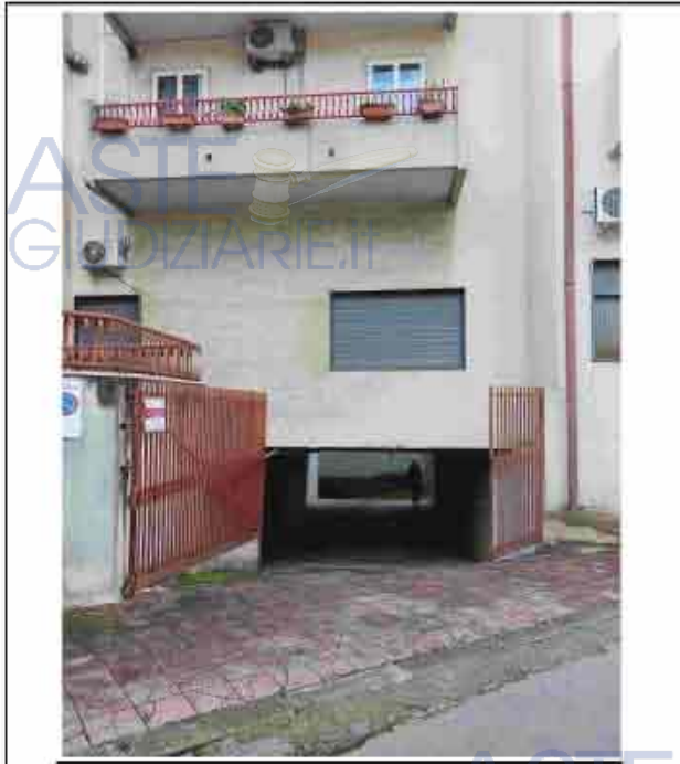
41. Rampa di accesso

Immobile alla via Fiume n. sc, piano S1, identificato al N.C.E.U. del predetto comune al foglio 8, particella 130, sub. 26, zona cens. 1, categoria C/6, classe 2, consistenza 22.00 m 2 , superficie catastale totale 25.00 m 2 , rendita Euro 57.95;