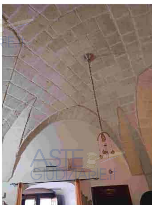
8.PT - Volta