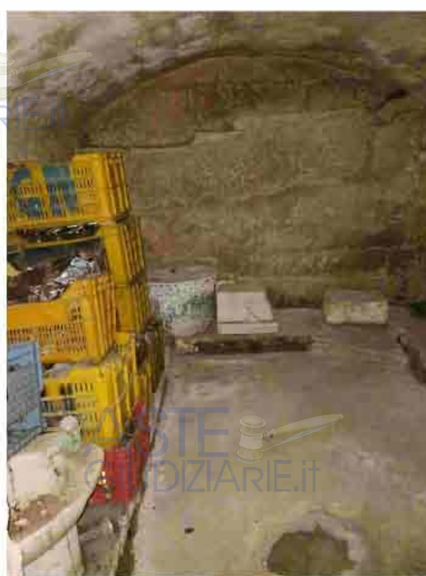
32. Piano interrato - cantina