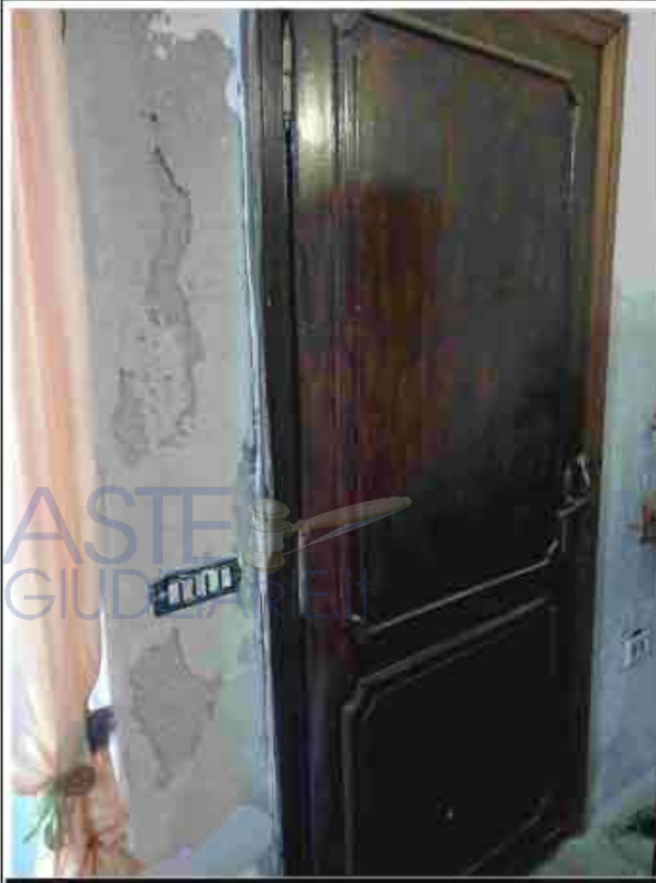
9. Infixo interno