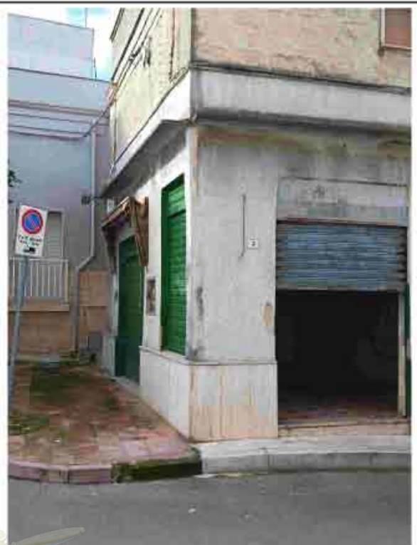
34. Prospetto su via Castriota ad angolo