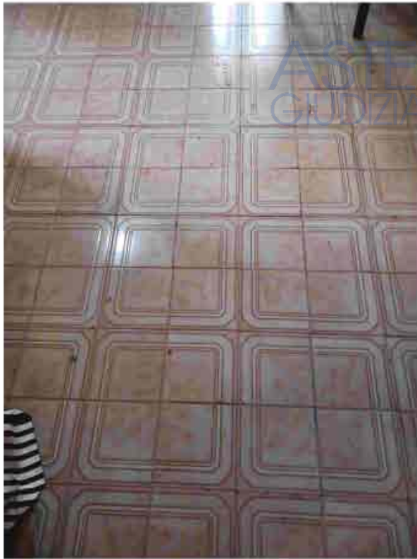
11. PT - Tipologia pavimentazione