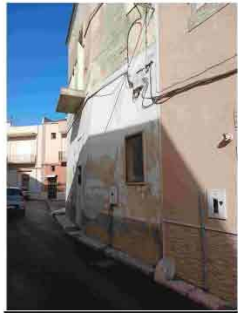
2. Prospetto su via Cesare Battisti guardando a nord-ovest