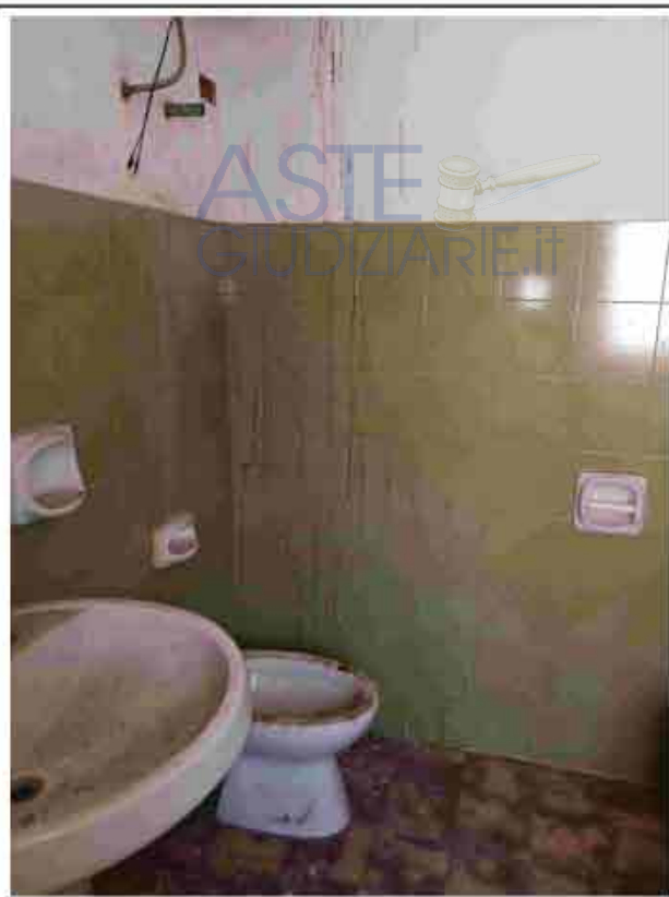
14. Primo Piano – W.C.