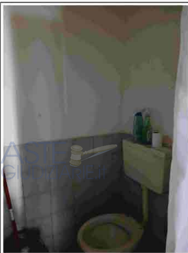
5.PT - W.C.