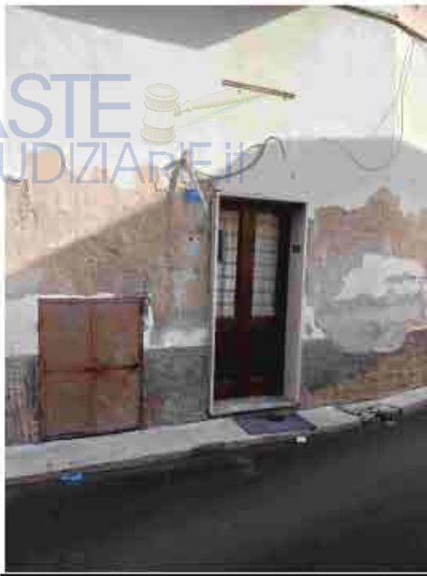
1. Prospetto su via Cesare Battisti n. 28

Immobile alla via Cesare Battisti n. 22 catastalmete, n. 28 civicamente, piano T-1-S-1, identificato al N.C.E.U. del predetto Comune al Foglio 11, Particella 332, zona cens.1, categoria A/4, classe 4, vani 5, superficie catastale totale 69.00 m 2 , totale escluse le aree scoperte 67.00 m 2 , rendita Euro 242.73;