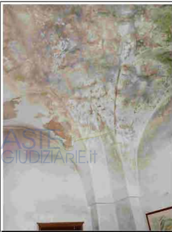
17. Primo Piano - Volta