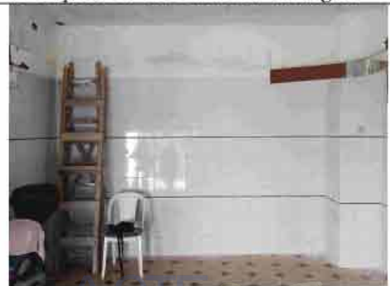
36. Locale commerciale