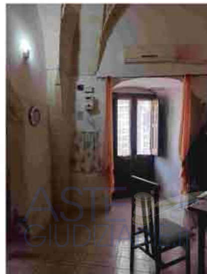
4.PT - Soggiorno