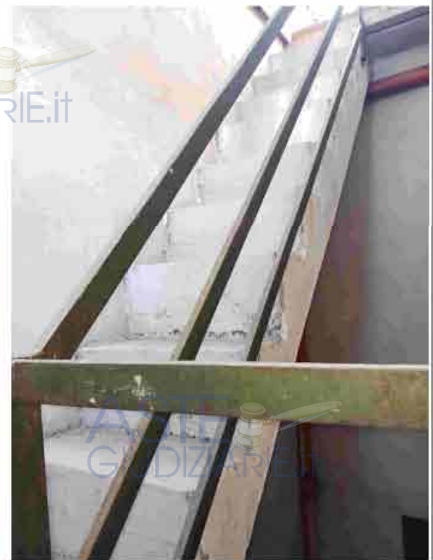
24. Primo Piano - Scala