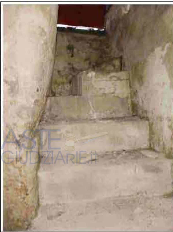
29. Piano interrato – scala di accesso