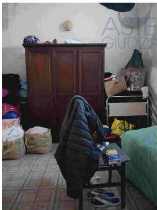
7.PT - Camera da letto