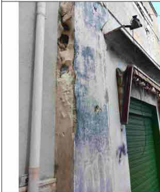
35. Dettaglio esterno