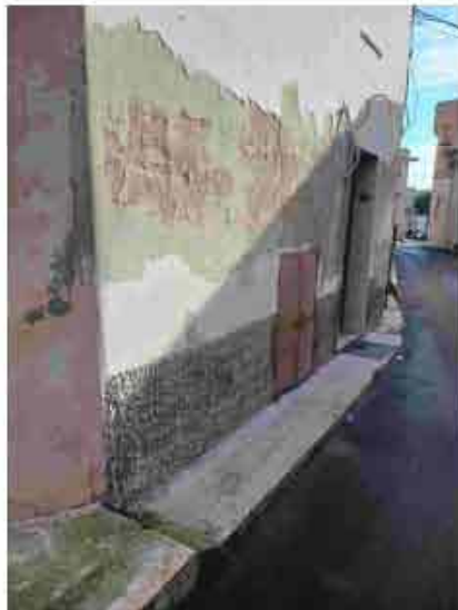
3. Prospetto su via Cesare Battisti guardando a sud-ovest