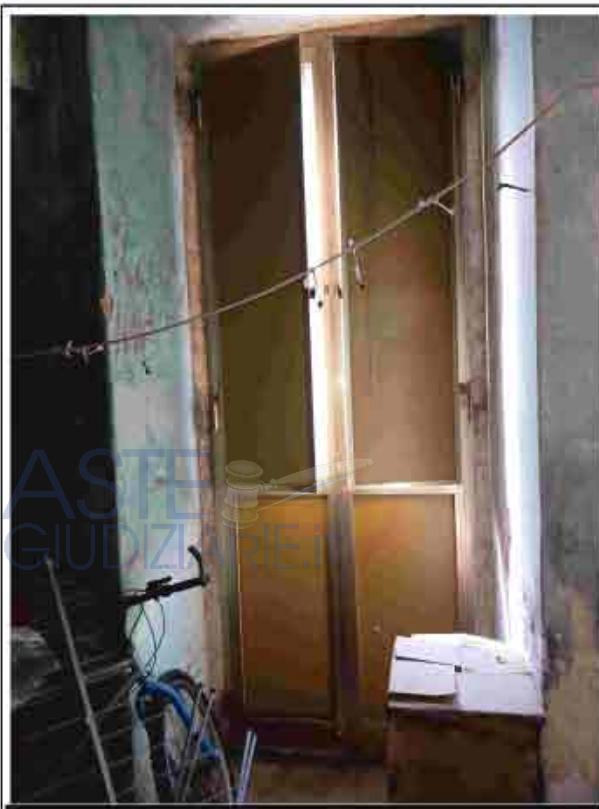
13. Primo Piano – Infisso esterno