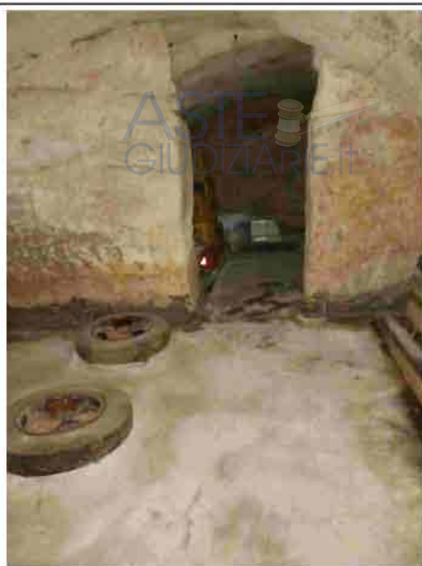
30. Piano interrato - cantina