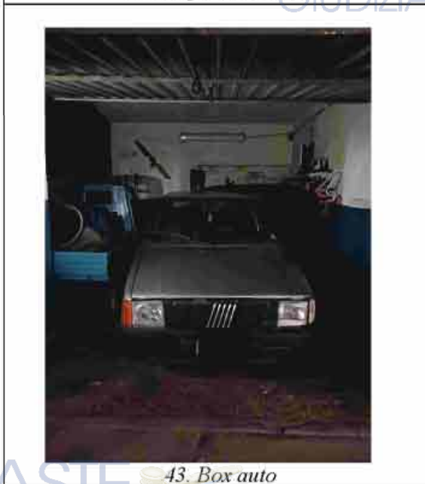
43. Box auto