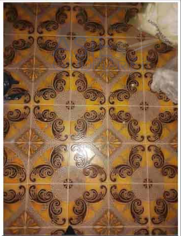
22. Primo Piano – Tipologia pavimentazione