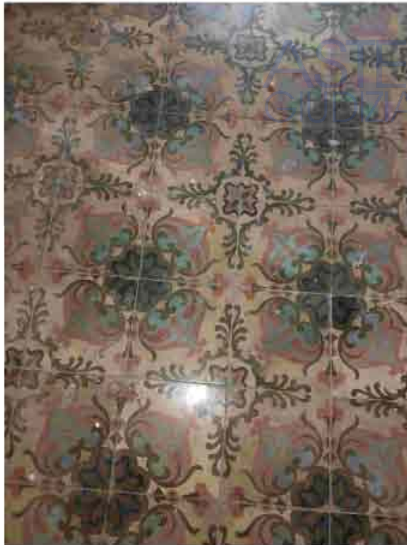
23. Primo Piano – Tipologia pavimentazione