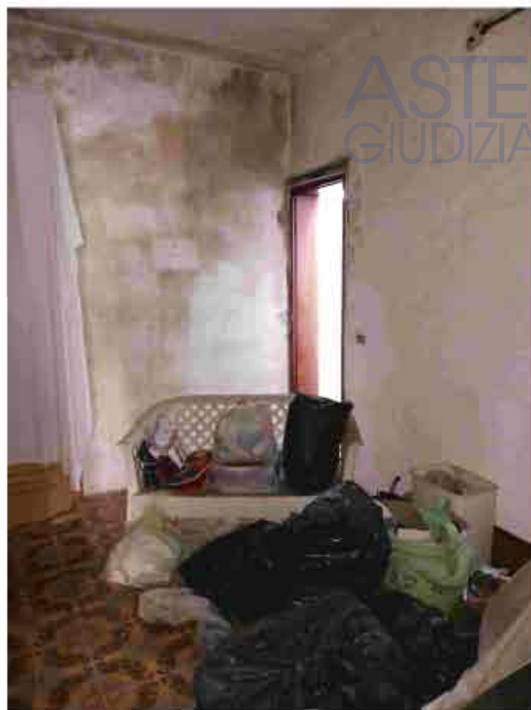
19. Primo Piano - Depositi di materiale