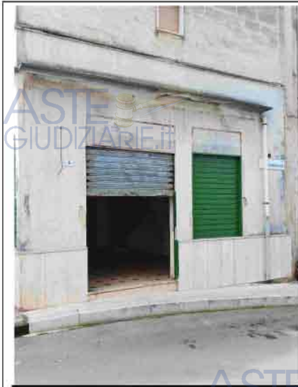
33. Prospetto su via Castriota

Immobile alla via Giorgio Schandemberg Castriota n. 2, Piano T, identificato al N.C.E.U. del predetto Comune al Foglio 11, Particella 553, sub.6, zona cens. 1, categoria C/1, classe 1, consistenza 22.00 m 2 , superficie catastale totale 25.00 m 2 , Rendita Euro 327,23;