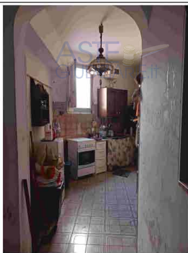
6.PT - Cucinino