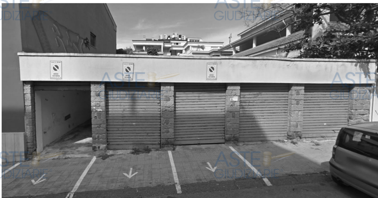
Figura 2- Ripresa Street View anno 2019