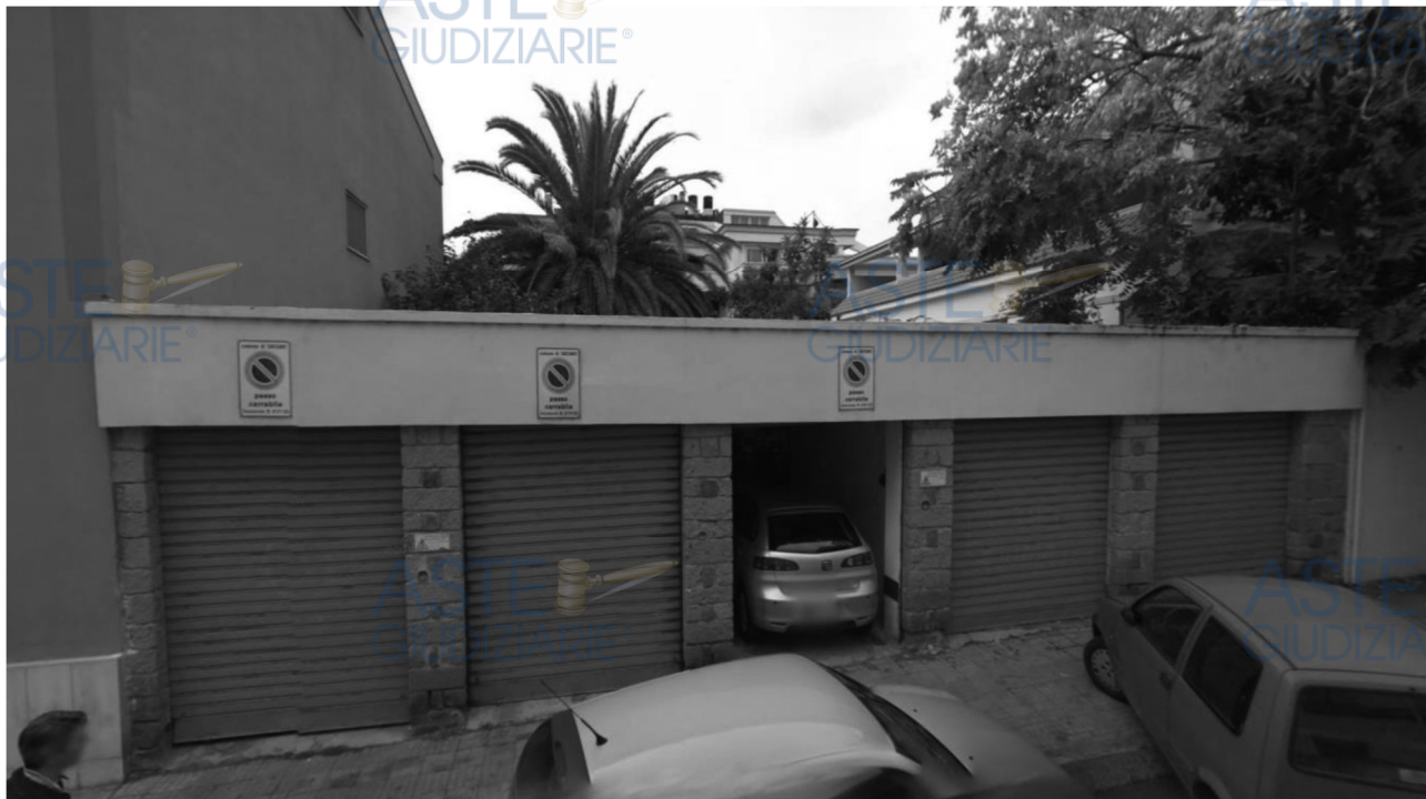
Figura 1- Ripresa Street View anno 2008

Si nota come due dei 5 box mostrino il vano garages nella condizione originale senza divisioni interne di sorta, si nota anche il grado di finitura e il livello manutentivo medio.