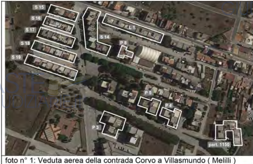
foto n° 1: Veduta aerea della contrada Corvo a Villasmundo ( Melilli )

La maggior parte degli appartamenti fanno parte della palazzina L1, tre fanno rispettivamente parte delle palazzine P8, P4 e S17.