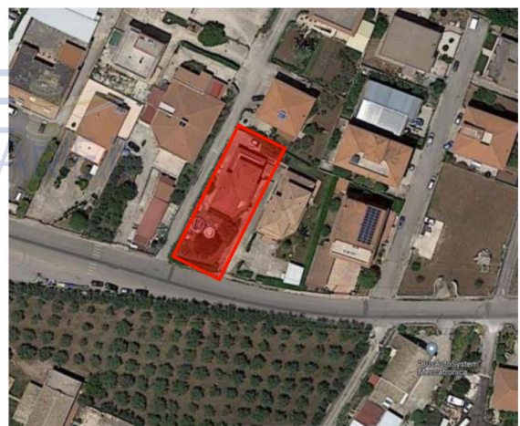
GEOLOCALIZZAZIONE GOOGLE RAVVICINATA