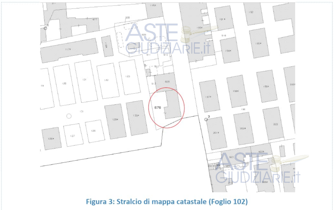
Figura 3: Stralcio di mappa catastale (Foglio 102)