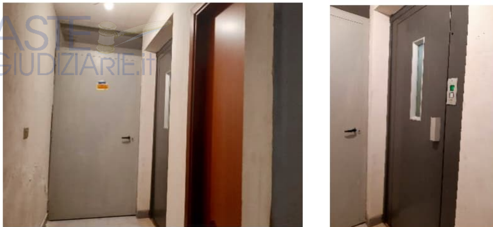
Figura 6: Ascensore condominiale

La suddetta rampa (scoperta) consente di accedere, a mezzo di serranda avvolgibile elettrica, al piano primo sottostrada, ed in particolare ad un'area di manovra comune (coperta), identificata con il subalterno n.17.