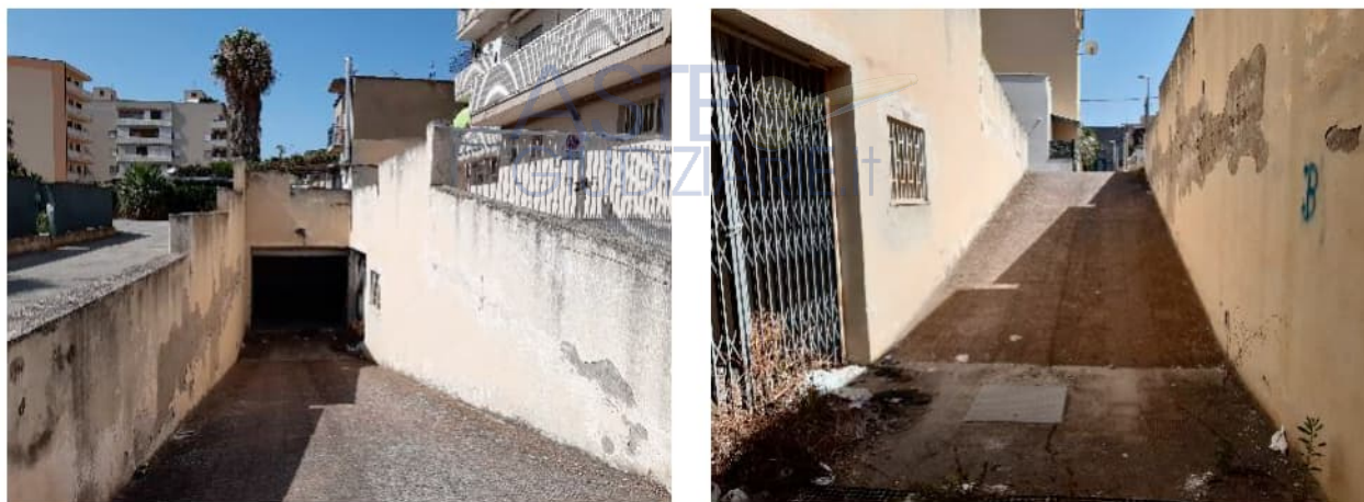
Figura 7: Rampa di accesso carrabile