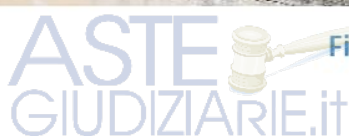
Figura 5: Prospetti esterni del fabbricato