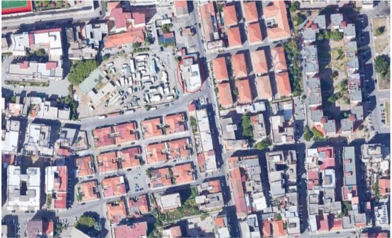
Figura 2: Vista aerea di dettaglio