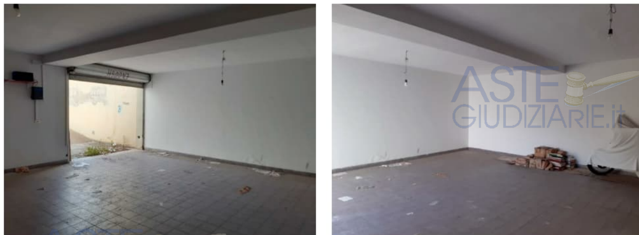
Figura 8: Area di manovra comune

Tale area di manovra consente l'accesso sia al subalterno 20 (altra proprietà, non oggetto della presente relazione) sia al subalterno 22 (ex sub. 19, oggetto della presente relazione).