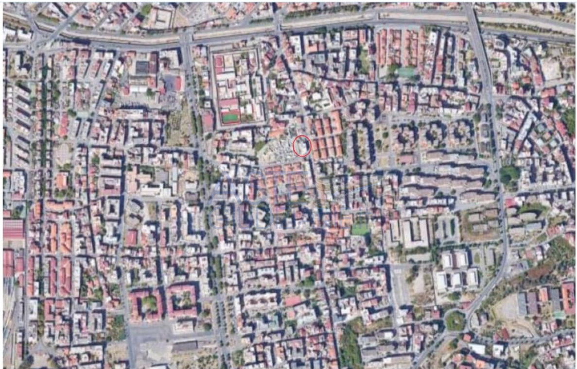
Figura 1: Vista aerea di inquadramento

Sulle suddette immagini, viene indicato, mediante polilinea di colore rosso, il fabbricato in cui sono ubicati i beni oggetto di pignoramento.