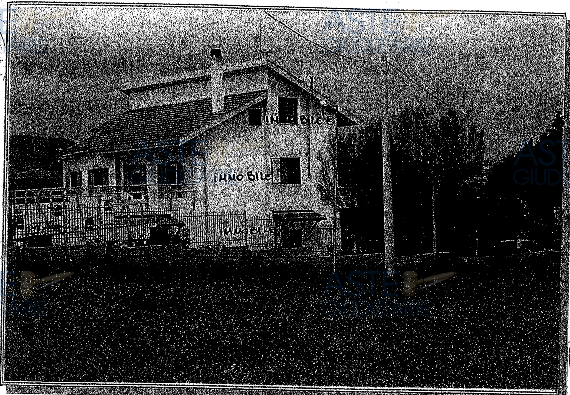
FOTO N° 1 - STATO DEI LUOGHI - COMUNE DI POTENZA FOG. 15 - PARTICELLE N° 1201/2 - 1201/3 - 1201/4 - IMMOBILI C - D - E -