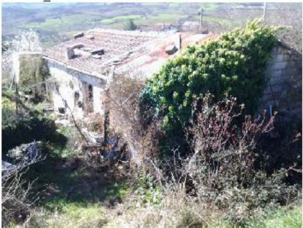
FG 55_P.lla 1035