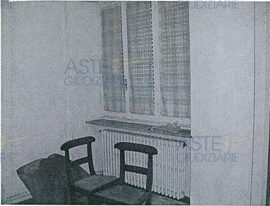
Vista interna abitazione PT