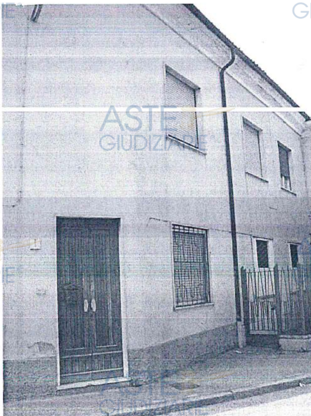
Viste esterne su via XX Settembre