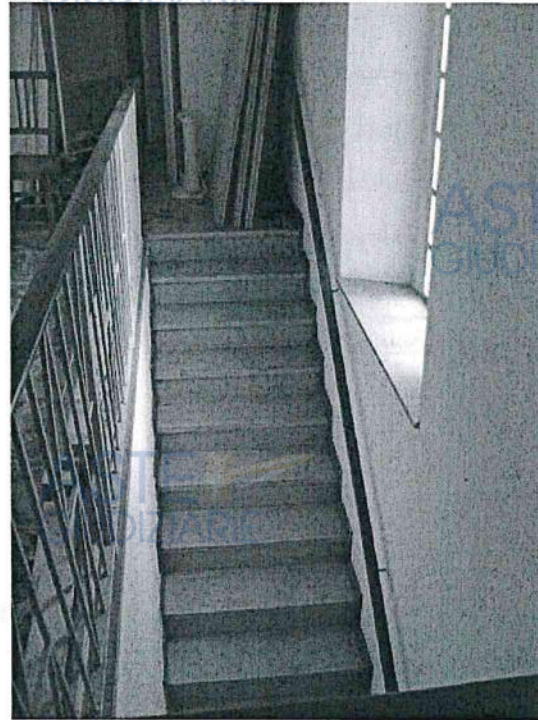
Vista interna abitazione – particolare vano scala e disimpegno P1