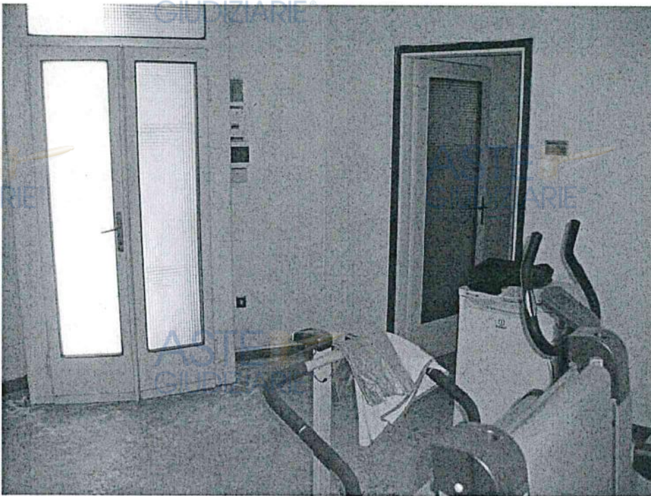
Vista interna abitazione PT - ingresso