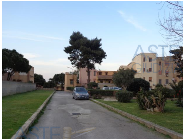
Porzione corte condominiale (particella n. 210)