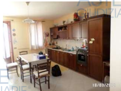
Figura 5: Vista soggiorno-cucina

All'interno del bagno, che risulta corredato di vaso, lavabo, bidet e doccia, è presente lo scaldabagno elettrico (All. 7, Foto 15). L'impianto idrico è sottotraccia, così come quello elettrico.