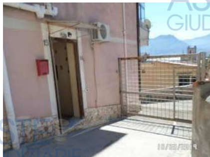
Figura 3: Vista ingresso

intonacate e tinteggiate. Le pareti del bagno, sono per buona parte rivestite di mattonelle, mentre la copertura e la parte rimante delle pareti risulta intonacata e tinteggiata. Gli infissi interni sono in legno tamburato, mentre gli infissi esterni sono di buona fattura e realizzati in legno con vetri a taglio termico (All. 7, Foto 12) e persiane esterne (All. 7, Foto 18).