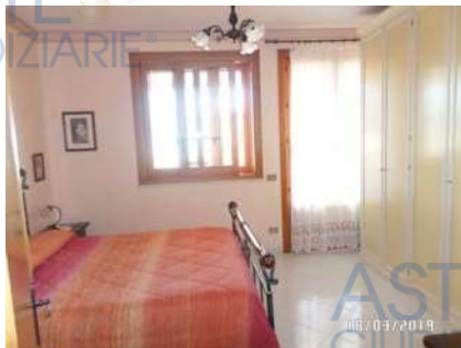
Figura 4: Vista camera da letto