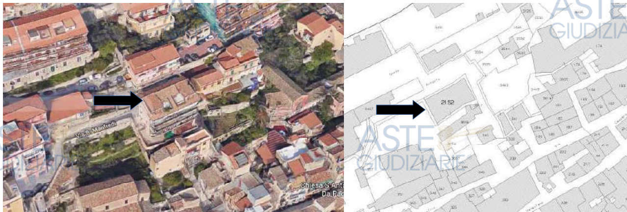
Comparazione tra stralcio maps, e stralcio di mappa catastale con indicazione del fabbricato di salita S. Antonino

Altresì, in riferimento alle difformità sostanziali si evidenzia che dai riscontri effettuati presso l'ufficio del catasto, si è appurato che l'attuale fabbricato, ed anche i singoli immobili che lo costituiscono, realizzati sulla particella 2152 non risultano accatastrati al Catasto fabbricati (per maggiori informazioni si rimanda alla risposta al successivo quesito n. 3).