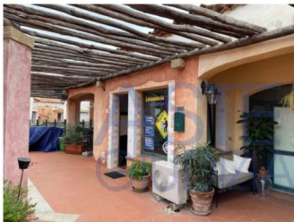
Esterni: fronte fabbricato e ingresso

Esecuzione Immobiliare R.G.E. n. 53/2020 Arch. Alessio Moledda Mail: alessiomoleddaarchitetto@gmail.com PEC: alessio.moledda@archiworldpec.it