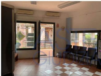
Esterni: locale commerciale

Esecuzione Immobiliare R.G.E. n. 53/2020 Arch. Alessio Moledda Mail: alessiomoleddaarchitetto@gmail.com PEC: alessio.moledda@archiworldpec.it