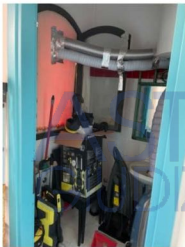
Interni: anti-bagno e bagno

Esecuzione Immobiliare R.G.E. n. 53/2020 Arch. Alessio Moledda Mail: alessiomoleddaarchitetto@gmail.com PEC: alessio.moledda@archiworldpec.it