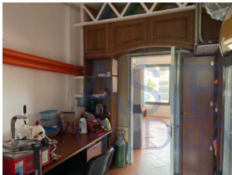
Esterni: locale commerciale (vano magazzino)

Esecuzione Immobiliare R.G.E. n. 53/2020 Arch. Alessio Moledda Mail: alessiomoleddaarchitetto@gmail.com PEC: alessio.moledda@archiworldpec.it