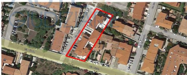
Figura 5 – Ubicazione – Santa Teresa di Gallura - il perimetro rosso segnala l'ingombro planimetrico del compendio nel quale sono allocati i beni immobiliari oggetto di procedura esecutiva

L'intero fabbricato si presenta in ottime condizioni di conservazione e di manutenzione , risultando di fatti pari al nuovo e necessitando esclusivamente di lievi interventi di ordinaria manutenzione.