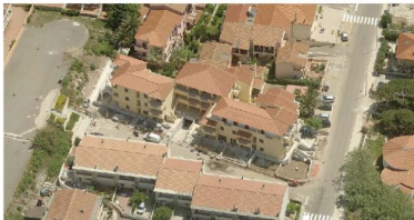
Figura 3 – Vista area del fabbricato che ospita i beni immobiliari oggetto di procedura esecutiva

I lotti di vendita saranno in sintesi suddivisi così come indicato nella tabella a seguire: