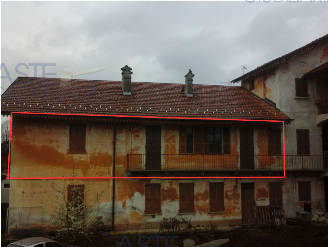
Prospetto fabbricato che ospita l'ufficio al 1° piano