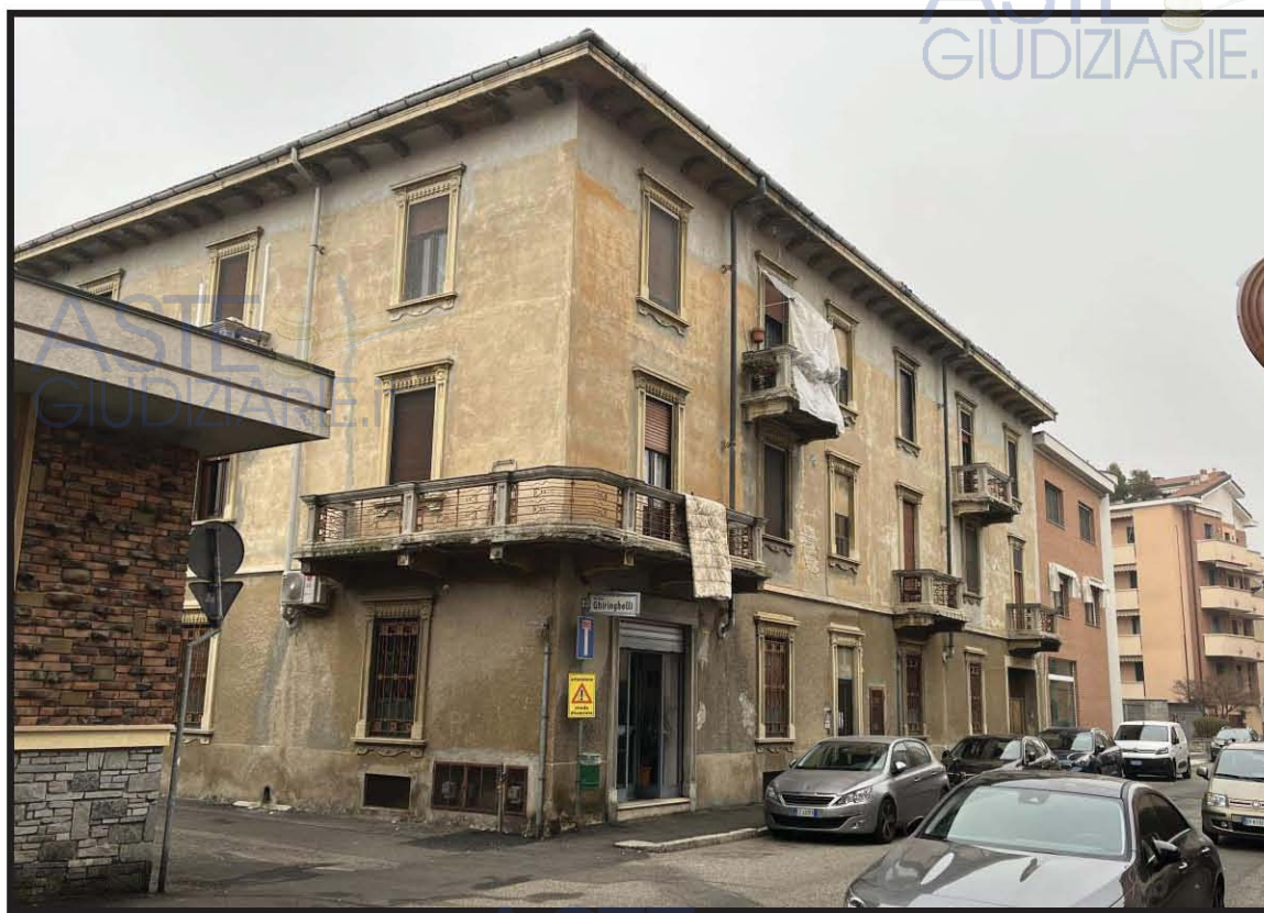
Vista d'insieme del fabbricato da via Stefano Melchioni – lato Sud/Est