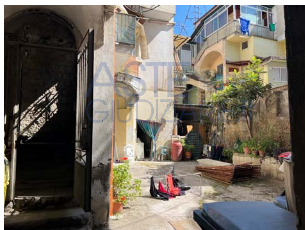
Vista di androne e cortile interno