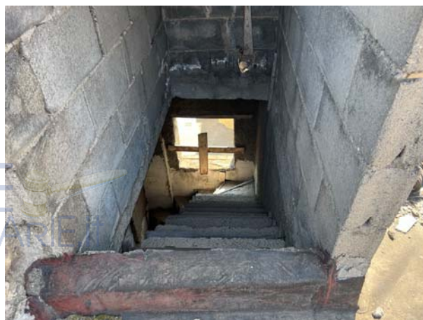
Dettagli delle rampe di accesso al terzo livello