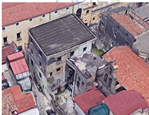
Viste aeree del complesso con accesso da via Annunziata n. 18, Acerra

L'accesso al complesso, in particolare, avviene dal civico n. 18 della predetta via Annunziata, dove un portone modanato immette nell'androne e da questi, successivamente, nel cortile interno su cui si aprono i varchi di ingresso alle unità terranee ivi allocate nonché al corpo scala che conduce ai piani superiori del manufatto.