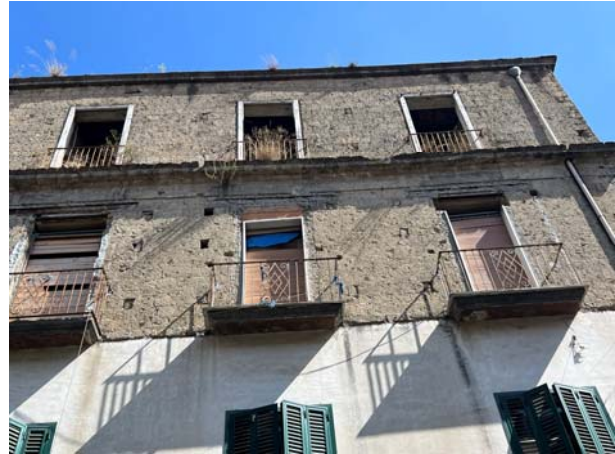
Vista dei piani terra e prima, a sinistra, e secondo e terzo, a destra

La consistenza staggita consta dell'appartamento che occupa l'intero terzo livello del suddetto manufatto, ossia quello edificato in sopraelevazione. L'accesso avviene dalla citata scala posta sul retro del corpo principale, con ingresso dal cortile, la quale, al piano terzo, smonta presso un lastrico non pavimentato, finito con il solo strato di tenuta e delimitato da un muretto al grezzo; il lastrico, che ha una estensione di circa 50 mq, si frappone tra il torrino della detta scala e l'appartamento stesso, cui offre accesso.