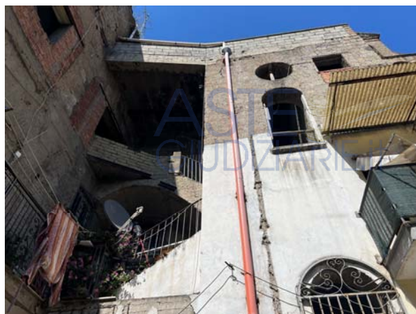
Vista di androne e cortile interno

Il detto corpo scala, in cattive condizioni di conservazione, disimpegna i piani primo e secondo attraverso dei ballatoi; in corrispondenza del secondo livello, giacché il terzo piano è una sopraelevazione postuma ancorché analogamente vetusta, la scala, che relativamente a detto tratto ha subito un rifacimento incompiuto, muta assetto e dimensioni, divenendo decisamente poco agevole, per poi smontare presso un terrazzo da cui, a sua volta, si accede all'unità staggita.