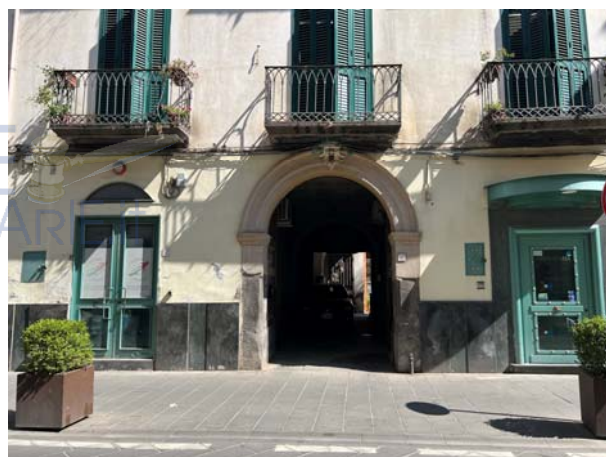
Vista della facciata principale del fabbricato e dettaglio del portone di accesso