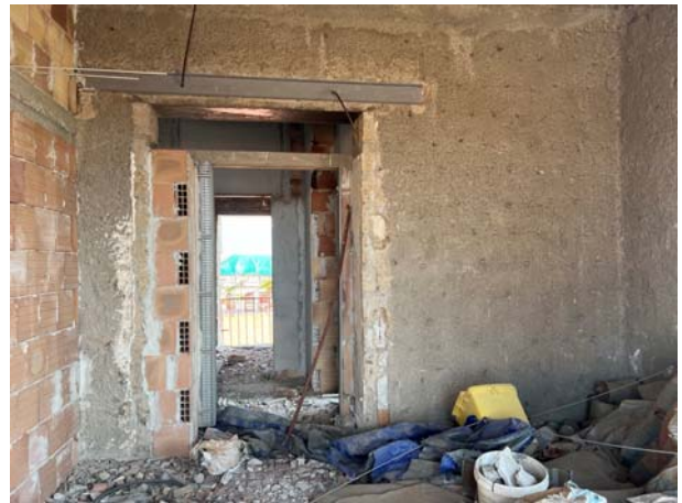
Dettagli interni dell'unità