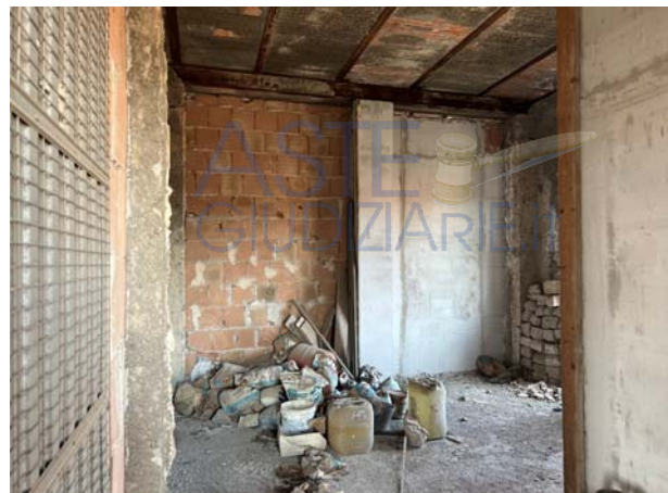
Dettagli interni dell'unità