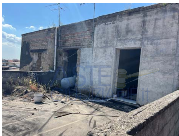
Vista del torrino di smonto della scala e del lastrico che offre accesso all'unità staggita

Il fabbricato di afferenza, come anticipato, è di vetusto impianto originario e, pertanto, risulta caratterizzato da tipiche modalità morfologiche e tecnologiche dei tempi (struttura portante in