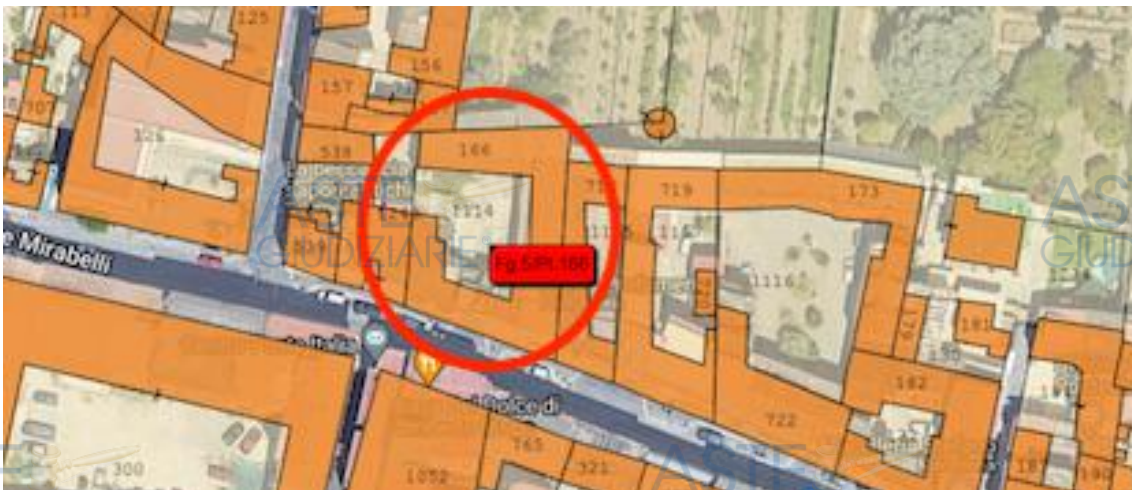
Foto n. 1 - SOVRAPPOSIZIONE VAX - ORTOFOTO

La sovrapposizione tra estratto di mappa ed ortofoto, individua correttamente il cespite pignorato.