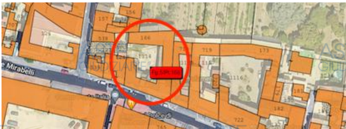
Foto n. 1 - SOVRAPPOSIZIONE VAX - ORTOFOTO

La sovrapposizione tra estratto di mappa ed ortofoto, individua correttamente il cespite pignorato.