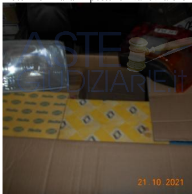
Foto n. 9- fanalini freccia anteriore