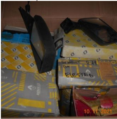
Foto n. 50 - Tiranteria varia