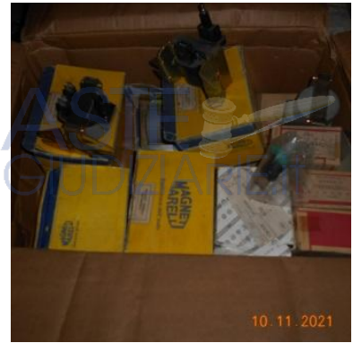
Foto n.52 - Targhetta Benazzato