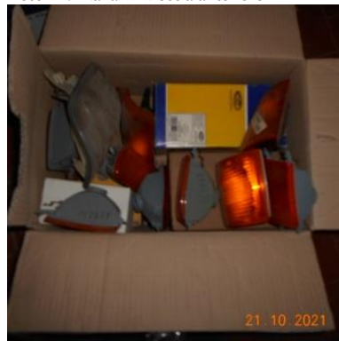
Foto n. 10 - Fanalini posteriori varie marche