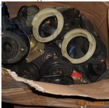
Foto n. 64 - Distanziali pompe benzina