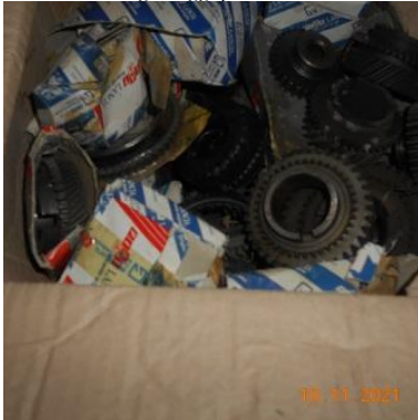
Foto n.56 - Cuscinetti