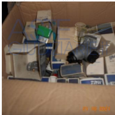
Foto n.33 - Specchietti