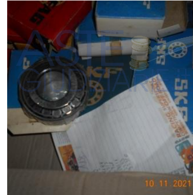
Foto n. 57 - Tiranteria varia