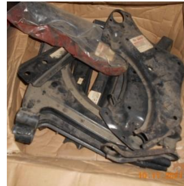
Foto n. 54 - Spingi disco