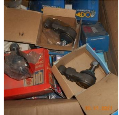
Foto n. 58 - Bracci oscillanti