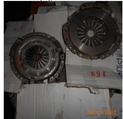
Foto n. 55 - Ingranaggi per cambio