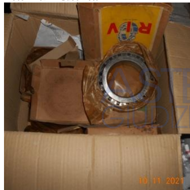
Foto n. 63 - Supporti ammortizzatore