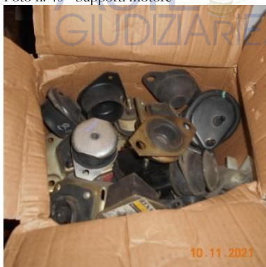
Foto n. 41 - Supporti motore