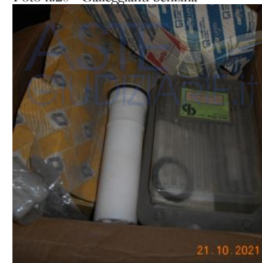
Foto n.21- Vaschette per acqua