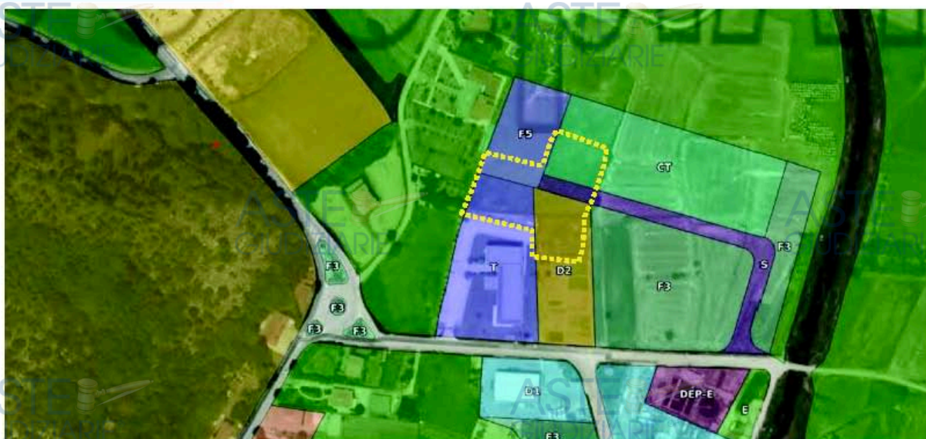
Figura 4: Stralcio PUA con zonizzazione, in giallo lotto in liquidazione

Si può notare che i terreni, individuati al Catasto Terreni del Comune di Sant'Artenio rispettivamente al fg. 8: