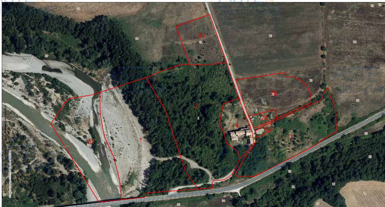
Mapa dei beni pignorati

I beni immobili oggetto del presente pignoramento comprendono porzioni di terreno di diversa qualità colturale per circa 10 ettari, un complesso immobiliare di n°18 appartamenti di circa 1.700 mq fra immobili e pertinenze, ed un fabbricato parzialmente demolito di circa 130 mq fra superficie e pertinenze.