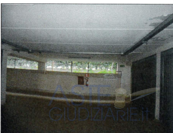
Vista piano interrato