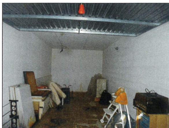
Box auto sub 36 (Lotto 2)