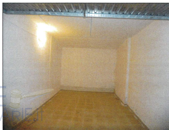
Box auto sub 38 (Lotto 4)