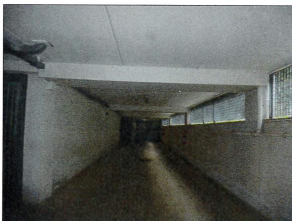
Vista piano interrato