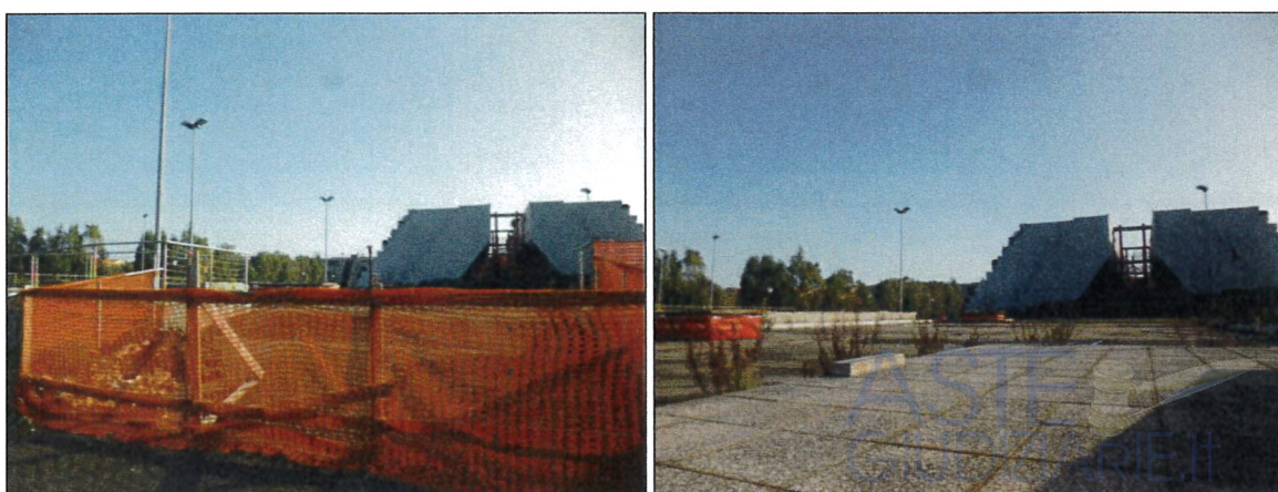
Vista frontale del parcheggio rialzato