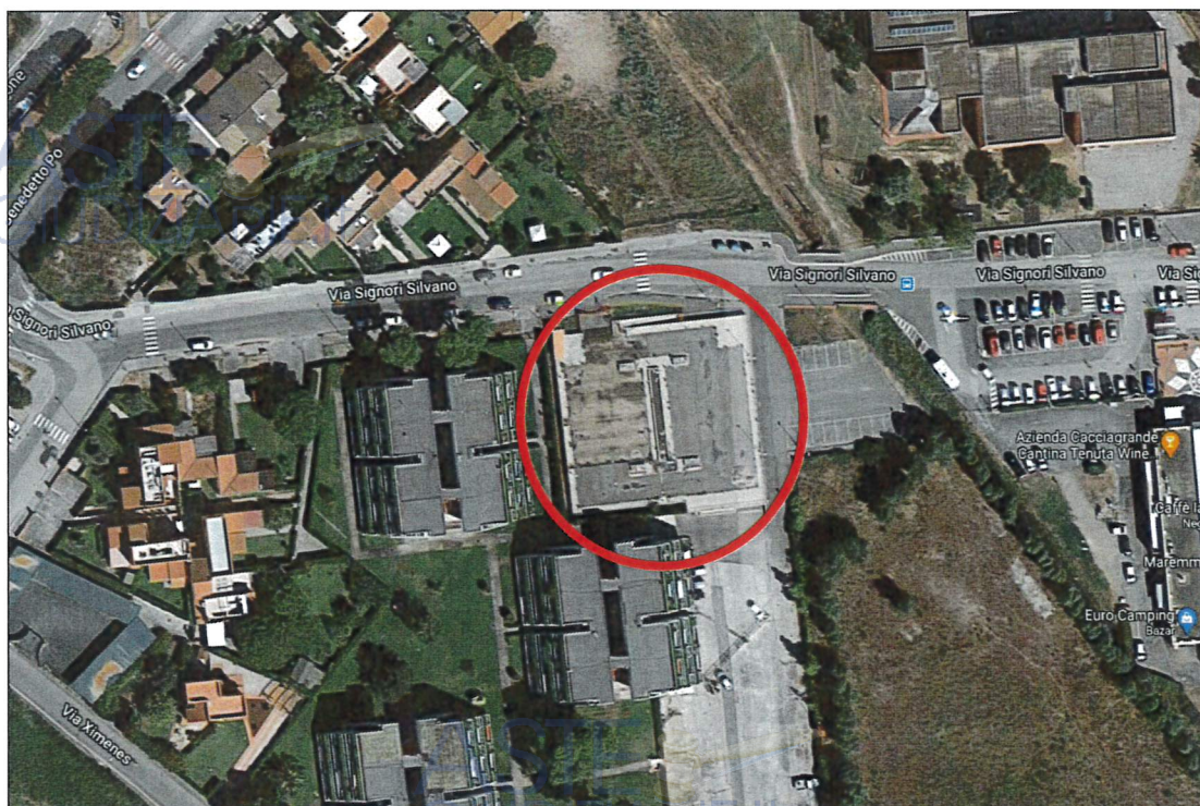
Vista aerea del parcheggio sito in loc. Paduline