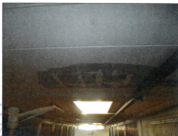
Vista piano interrato