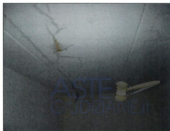
Particolare infiltrazione Lotto 2