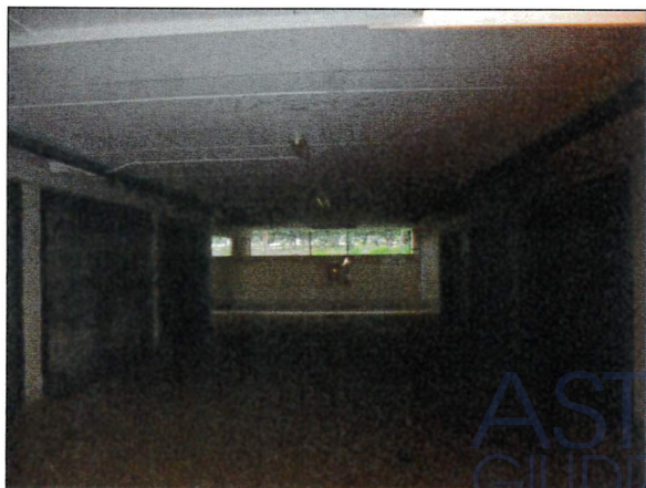
Vista piano interrato