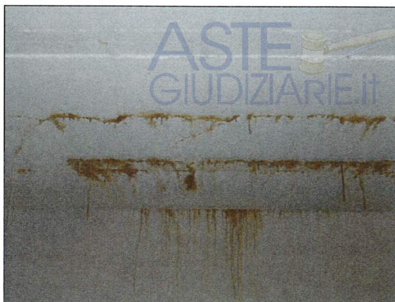
Particolare infiltrazione box Lotto 3