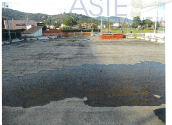
Vista pavimentazione parcheggio rialzato