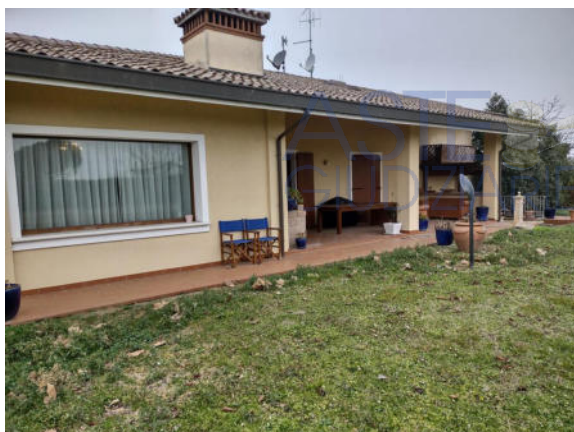
Porzione della villa bifamiliare che contiene l'abitazione oggetto del LOTTO DUE