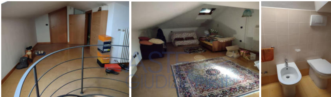
Piano sottotetto: il vano principale e il bagno non autorizzato