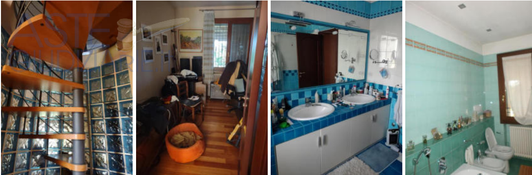
Piano terra rialzato: una camera da letto, lo studio e i bagni