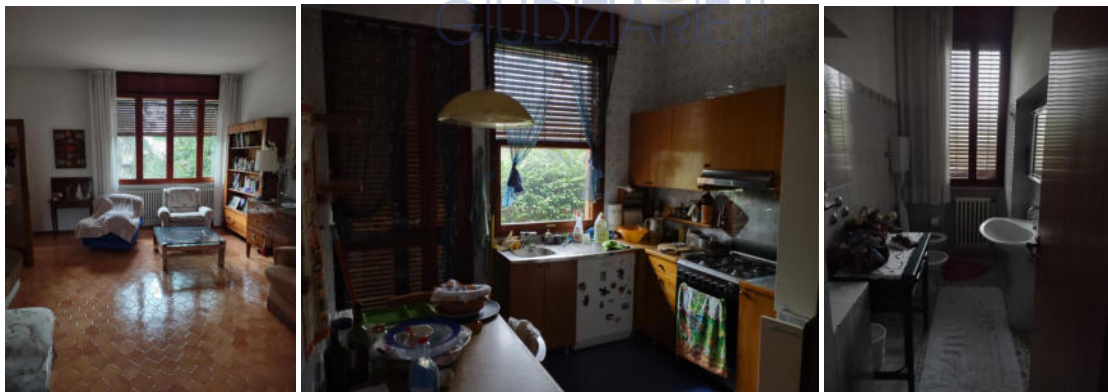
Piano primo: il soggiorno, la cucina e il wc di servizio