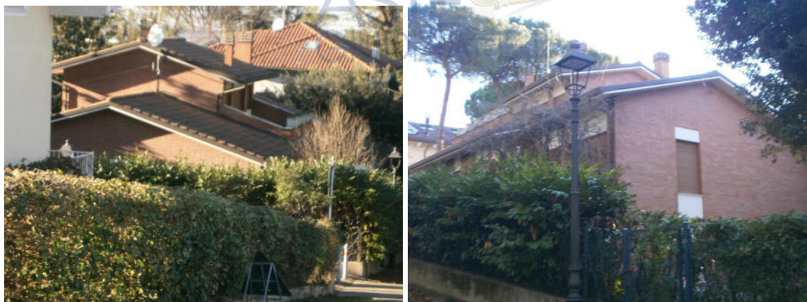
La villetta vista da Via delle Scalette e dalla Via Bellini

Lo stato attuale dell'immobile risulta dalle planimetrie catastali (v. all. C.2) e dal rilievo fotografico degli esterni e degli interni (v. all. C.1).