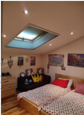
Piano sottotetto: vista dall'ingresso del soppalco; bagno; locale ad uso servizio