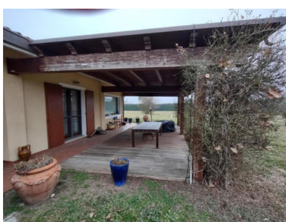
Porzione della villa bifamiliare:prospetto laterale sud, tettoia non autorizzata