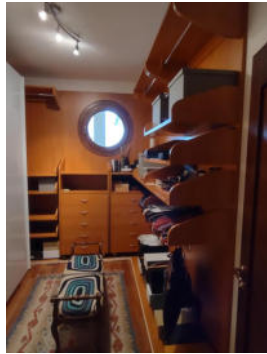
Piano terra-rialzato: il bagno; la camera da letto; il locale guardaroba