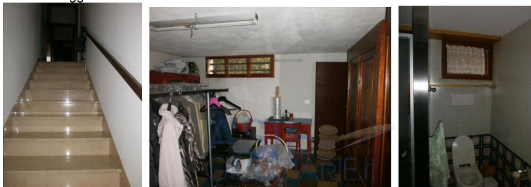
Piano seminterrato: la scala interna, il laboratorio artigianale e il wc di servizio