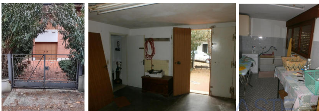
Piano seminterrato: Il garage e la lavanderia