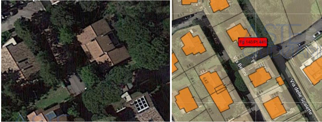
Vista dall'alto della villa (google maps) e sovrapposizione alla foto di estratto di mappa

Oggetto del pignoramento è una villetta unifamiliare dotata di un garage, un laboratorio artigianale e di una corte esclusiva sita al n. 85 di via Bellini a Cesena. Via Bellini fa parte del nucleo di prima edificazione dell'area definita "del Monte", poi divenuta una delle zone residenziali più apprezzate della città, a ridosso del Giardino pubblico e del centro storico cesenate.