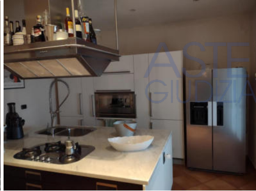
Piano terra-rialzato: il soggiorno-pranzo; la cucina