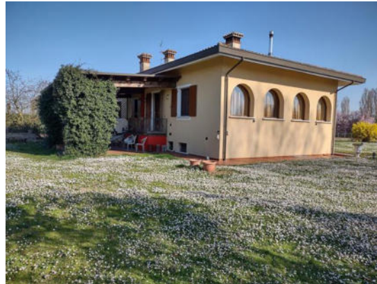
La porzione di villa bifamiliare che contiene l'abitazione del LOTTO UNO