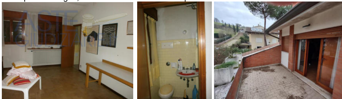
Sottotetto: Il soggiorno- studio nella terrazza e il wc di servizio