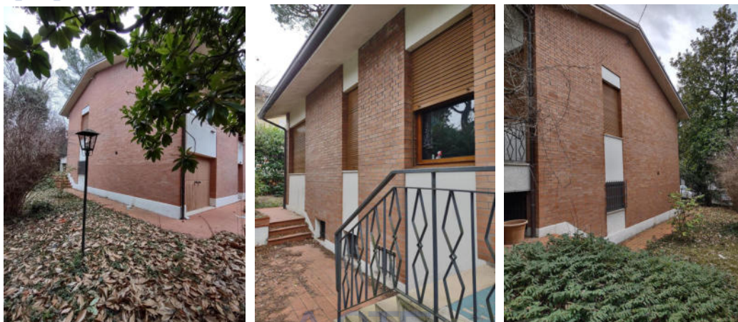
Prospetti laterali e retro