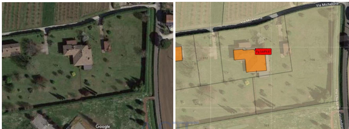
Vista dall'alto della villa bifamiliare e sovrapposizione alla foto di estratto di mappa

Oggetto del pignoramento è un'abitazione con corte esclusiva che fa parte di una villa abbinata, sita in via vicinale Michelona (ai numeri 220 e 250) a San Cristoforo di Cesena. San Cristoforo è una frazione del quadrante nord-est del Comune di Cesena, poco distante dal quartiere fieristico e dal casello autostradale di Cesena Nord, attraversata dalla SP 105 e al confine con il Comune di Bertinoro. Via Michelona è una strada di campagna non asfaltata posta alle spalle del nucleo principale della frazione e a breve distanza da questo.