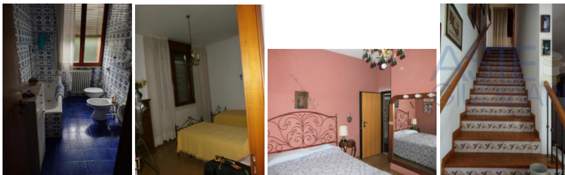
Piano primo: il bagno, le camere da letto e la scala per il sottotetto