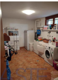
Piano seminterrato: il locale con angolo palestra; il bagno e la lavanderia