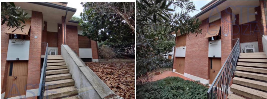
Fronte principale su Via Bellini e scala esterna di ingresso all'abitazione