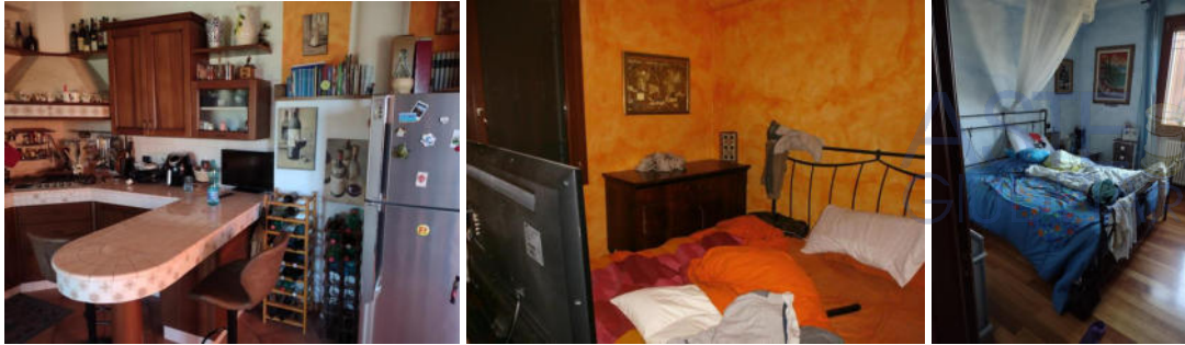
Piano terra rialzato: cucina, camera da letto