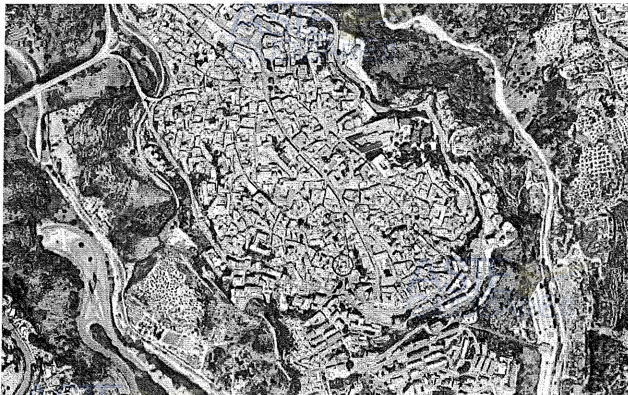
Fig. 1 – Ubicazione dell'immobile pignorato su scala territoriale

L'appartamento oggetto di pignoramento è ubicato al primo piano di un edificio di antica edificazione a due piani fuori terra sito in Catanzaro, nella zona sud del centro storico della città, all'angolo tra Via Gradoni Porta Marina e Via Discesa Carbone, (vedi Figg. 1 e 2), avente struttura portante in muratura di pietrame dello spessore di circa 70 cm e copertura a falde inclinate con manto in tegole coppi.