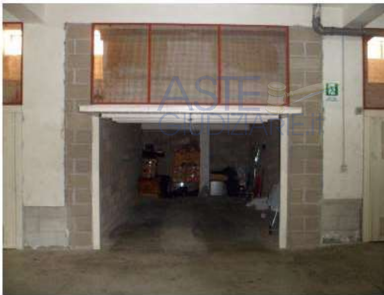
Foto n°8–Garage Sub 75 al n°33 rifiniture interne, pareti con mattoni a vista e pavimentazione in cemento liscio.