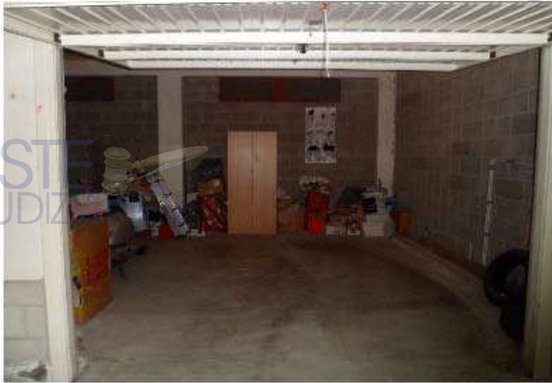
Garage sub 66 al n°24