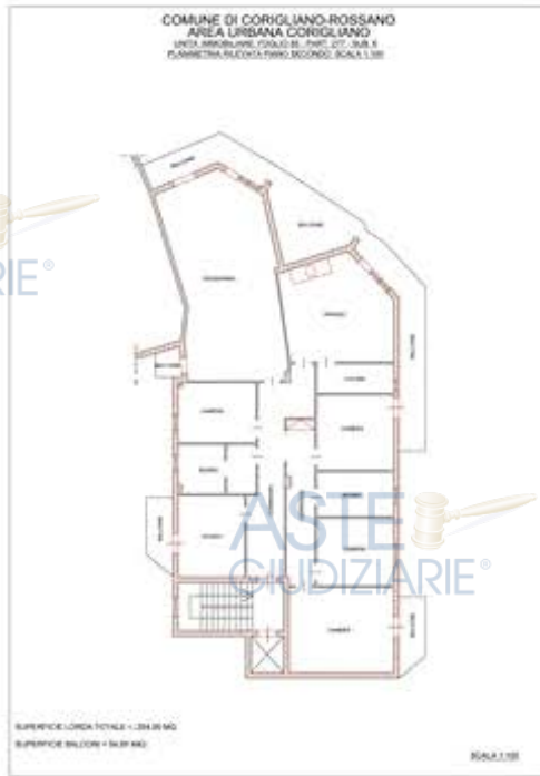
PLANIMETRIA STATO ATTUALE

Tempi necessari per la regolarizzazione: 1 mese