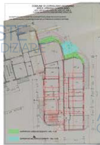
PLANIMETRIA DI RAFFRONTO TRA STATO ATTUALE E STATO AUTORIZZATO