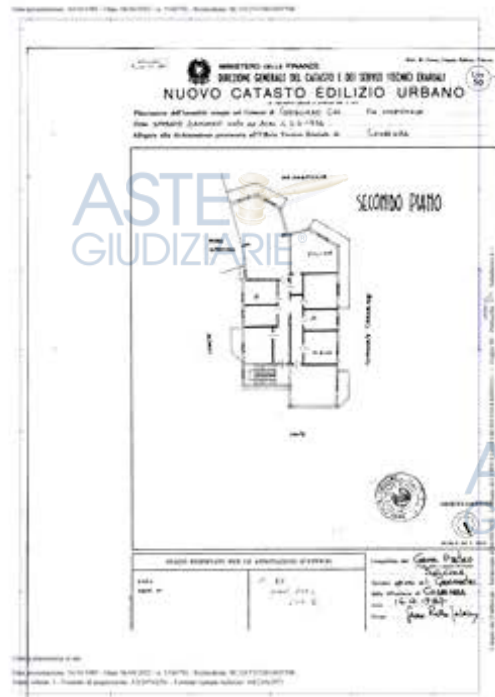
PLANIMETRIA CATASTALE IN ATTO