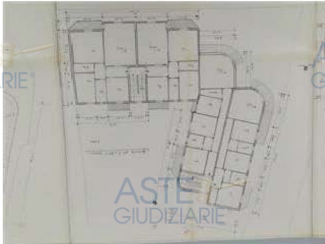
AUTORIZZATO CON LICENZA E DILIZIA N°40 DEL 09.12.1972

Tempi necessari per la regolarizzazione: 6 MESI