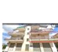
Prospetto su Via V. Vattimo