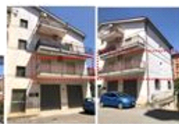
Prospetto su spazio condominiale angolo Via V. Vattimo