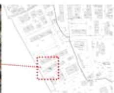
Fig. 02: Inquadramento planimetrico catastale dell'immobile pignorato