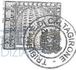
tavola N. 2.