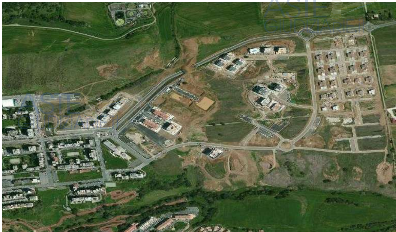
2 - COMPRESORIO P13 - AREA PER EDIFICI A TORRE A8 - A9