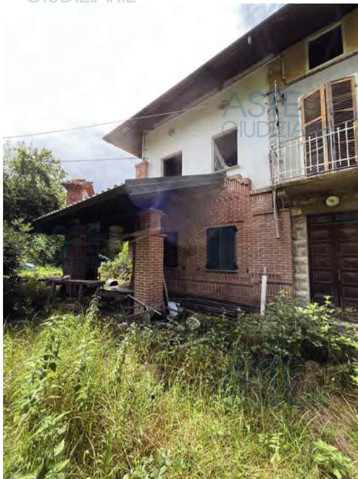
Vista esterna facciata principale