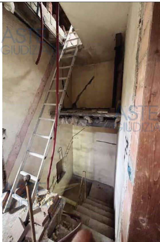
Interno locali al piano primo