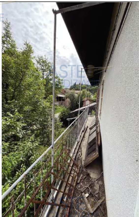
Balcone piano primo