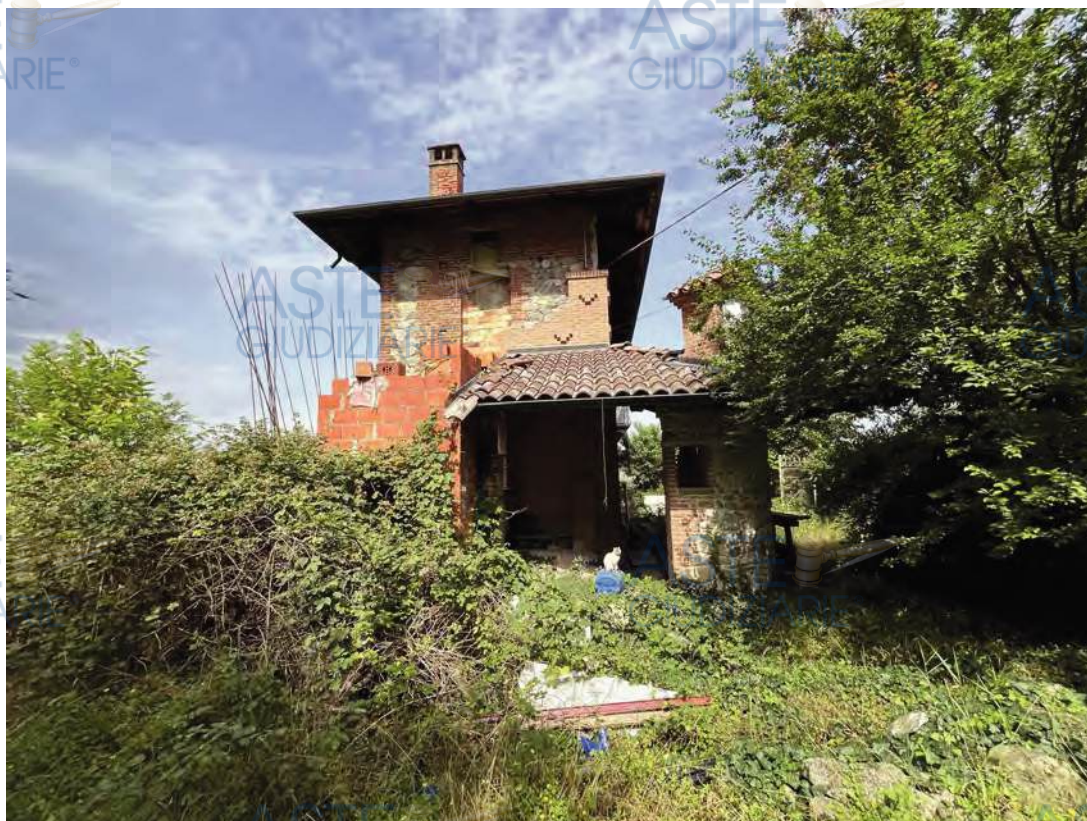
Vista esterna da ovest