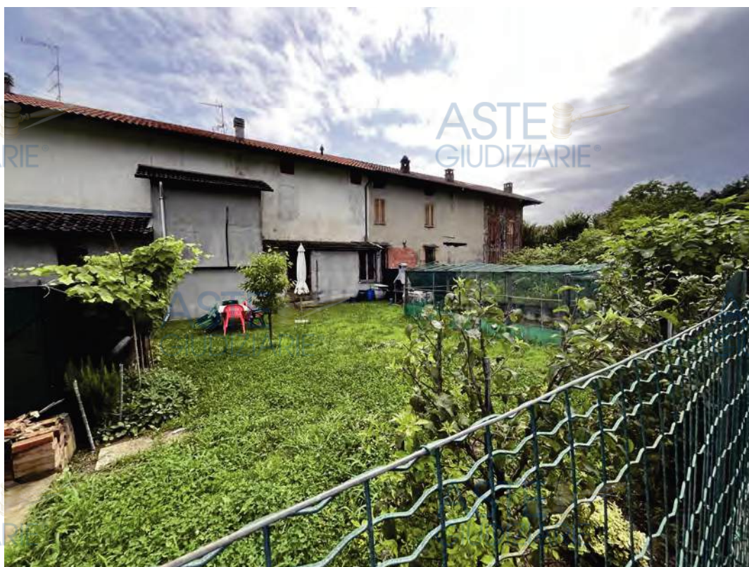
Vista esterna sul retro