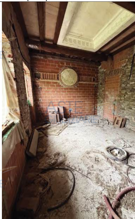
Locale al piano primo