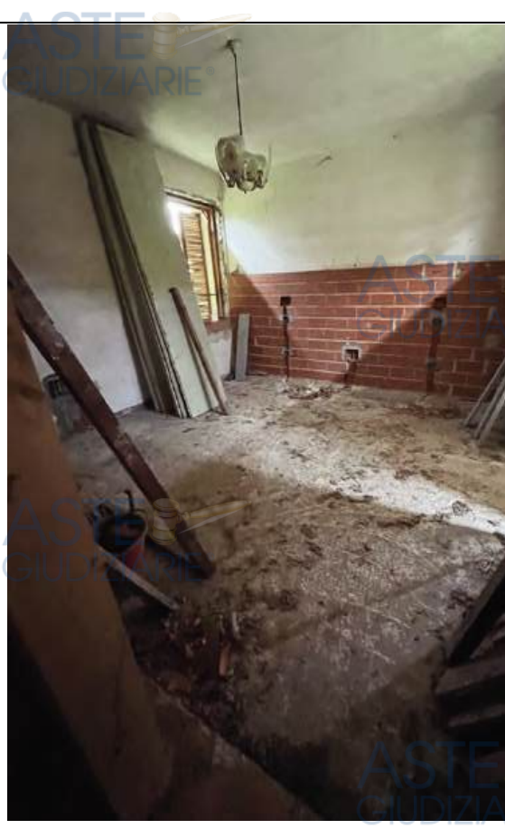
Interno locali al PT