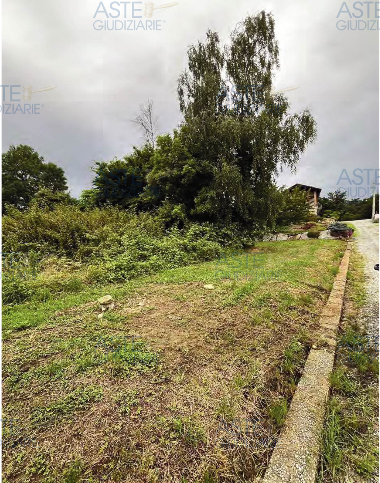
Terreno visto dalla strada Salussola San Secondo

Lotto 2 – Appezamento di terreno incolto della superficie di 2.590 mq. Inserito in Area di Completamento che prevede una edificabilità pari a 1000 mc. In Comune di Salussola (BI) – Regione Bergana