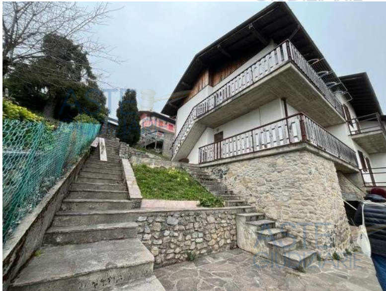
Fronte Sud- Ovest - P. sem. P. rial e P. 1