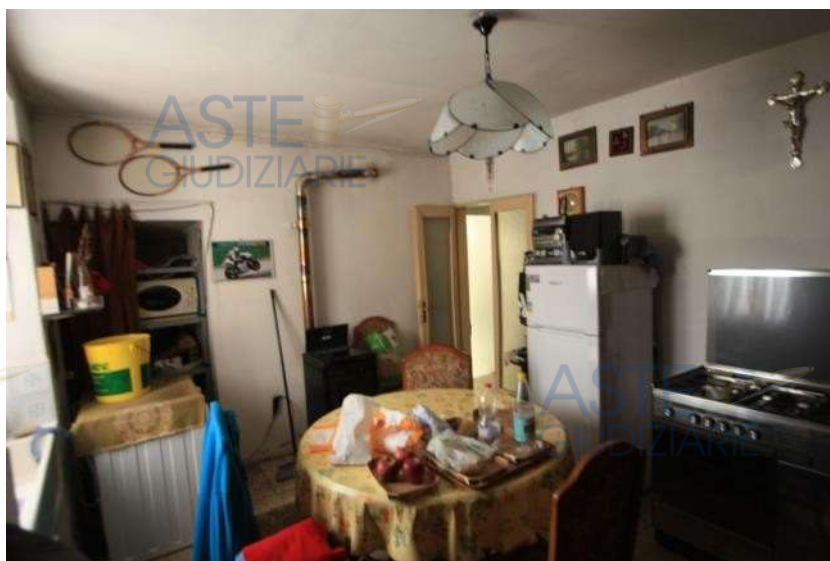
2° vano di proprietà