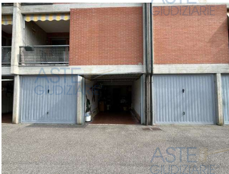
Autorimessa + Cantina