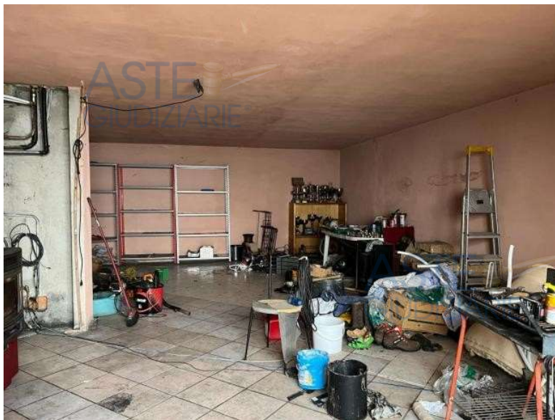
Taverna P. sem.