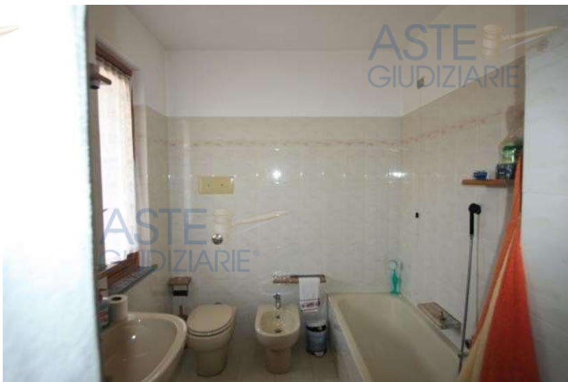
Bagno - P1