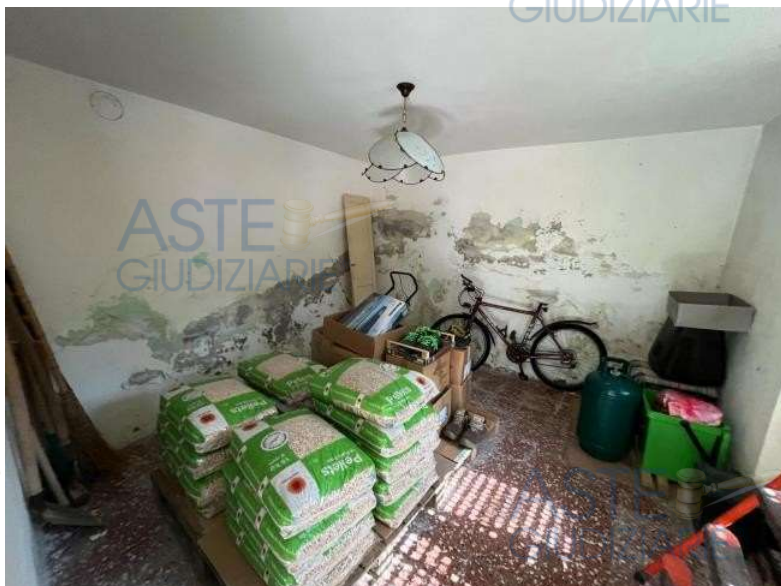
1° vano di proprietà