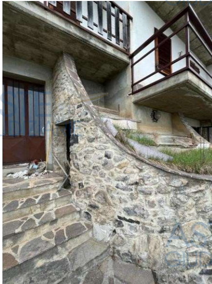
Accesso P. sem