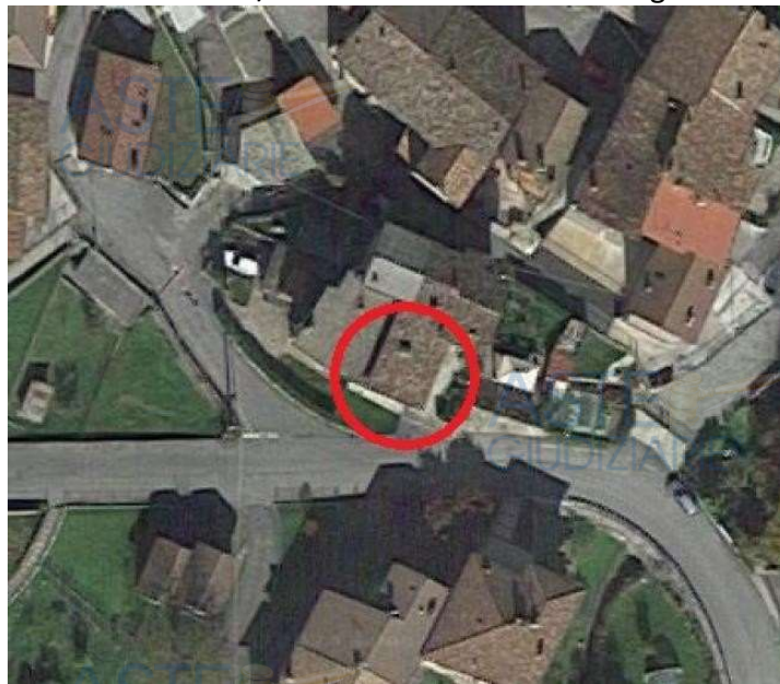
LOTTO 003/ SAN G. BIANCO – Via Roncaglia