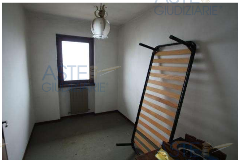
Camera - P. 1