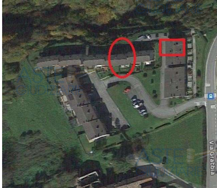
LOTTO 003 / SAN G. BIANCO – Via Piazza