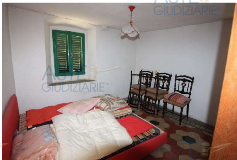
4° vano di proprietà