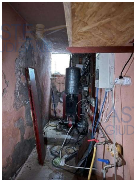
Ripostiglio - P. sem.