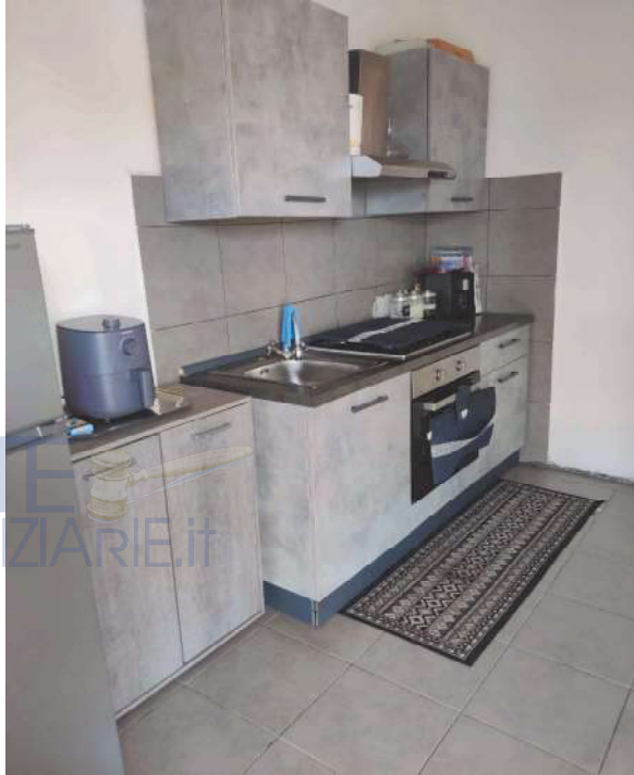
Foto 7 - vista cucina