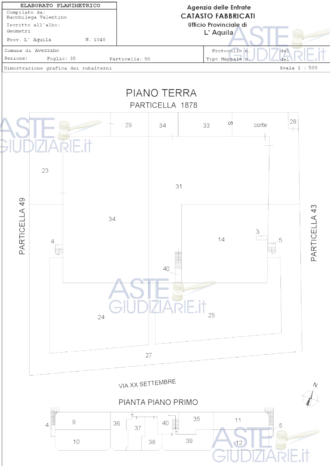
ELABORATO PLANIMETRICO – P.Illa interessata: Piano Primo - sub.11