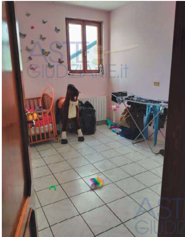
Foto 8 - vista camera