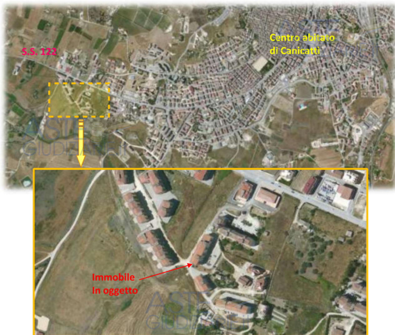
Fig. 1 – zona di ubicazione dell'immobile all'interno del centro abitato