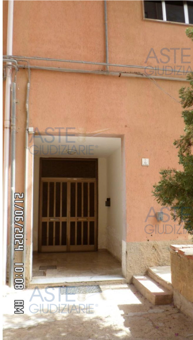
Foto 4 - Veduta del portone d'ingresso