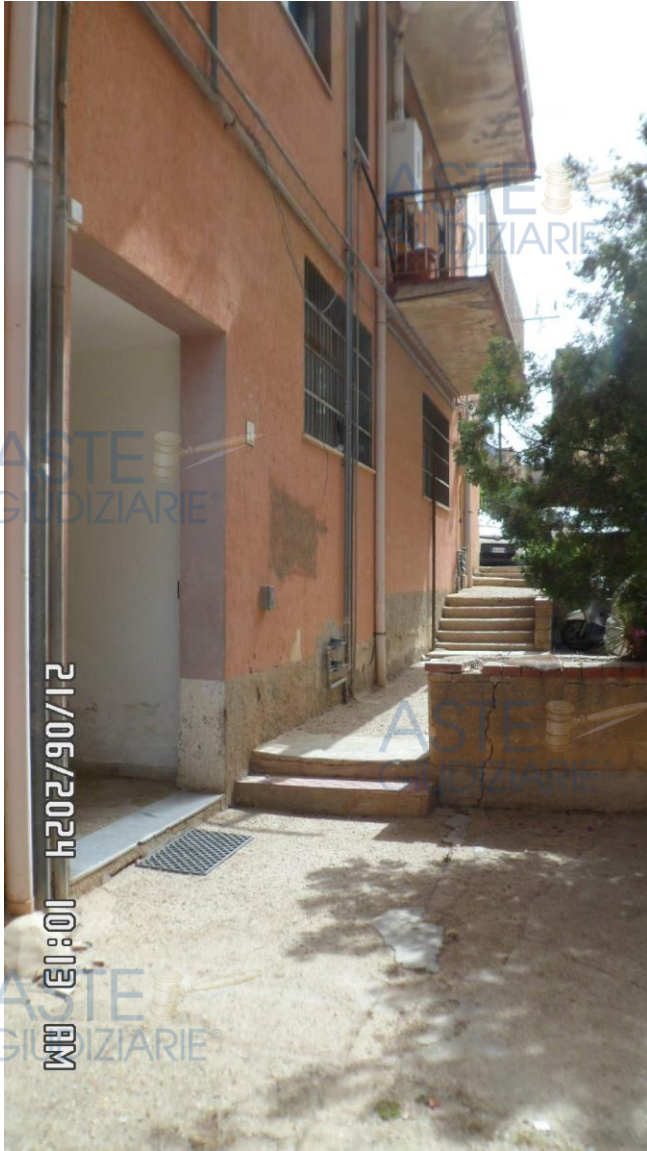
Foto 3 - Veduta dell'ingresso