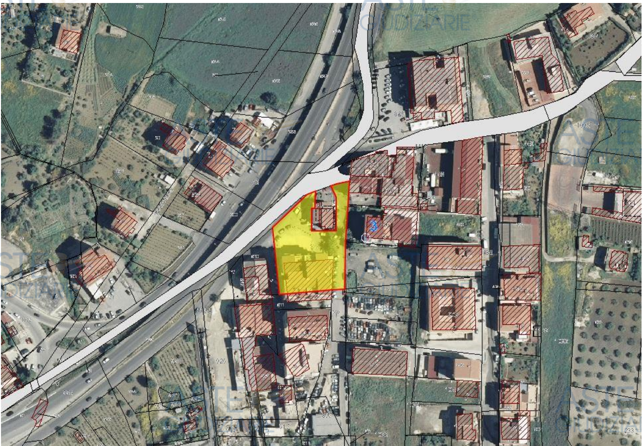
Figura 2 – Sovrapposizione di catastale su ortofoto.