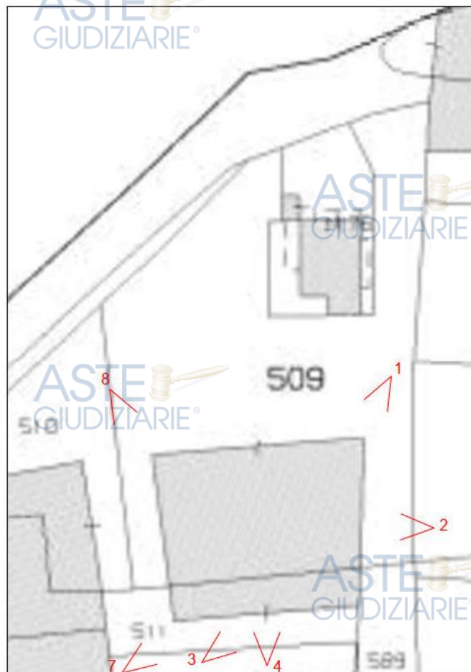
Stralcio catastale con indicazione dei coni ottici.