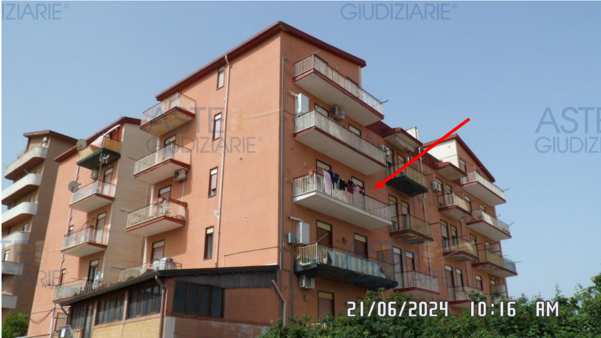
Foto 1 – Veduta dell'appartamento a terzo piano da via Unità d'Italia