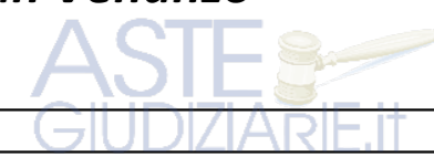
TAVOLA Num. 3

Progetto divisionale di beni immobili (terreni e fabbricati) ubicati in loc.tà Felcete Comune di San Venanzo