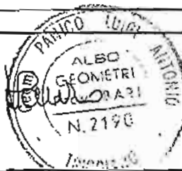
tavola: unica scala : 1:4.000 - 1: 1.000 - 1:100