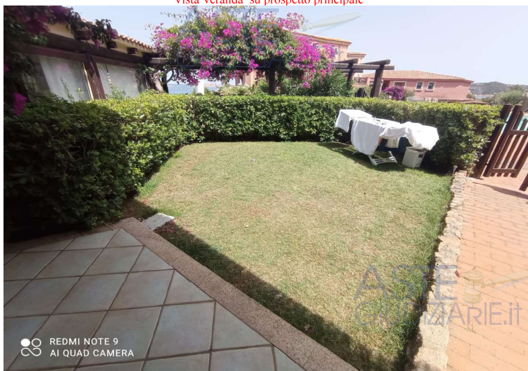
Vista giardino su prospetto principale