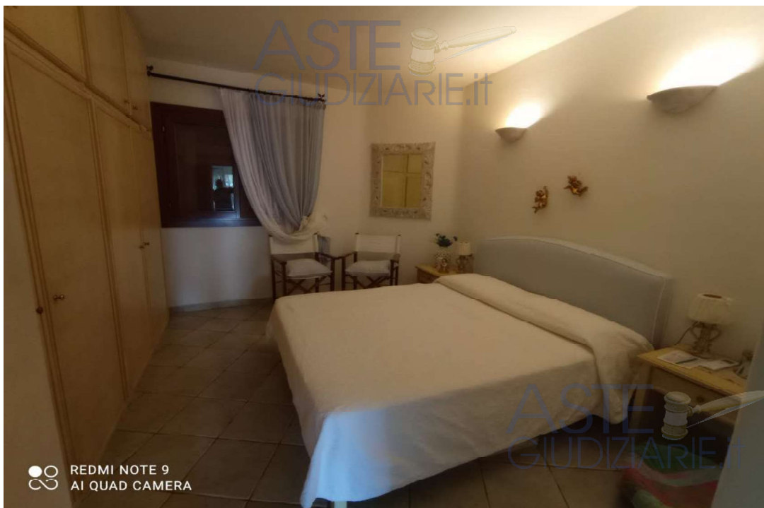
Vista Ambiente Camera da letto matrimoniale