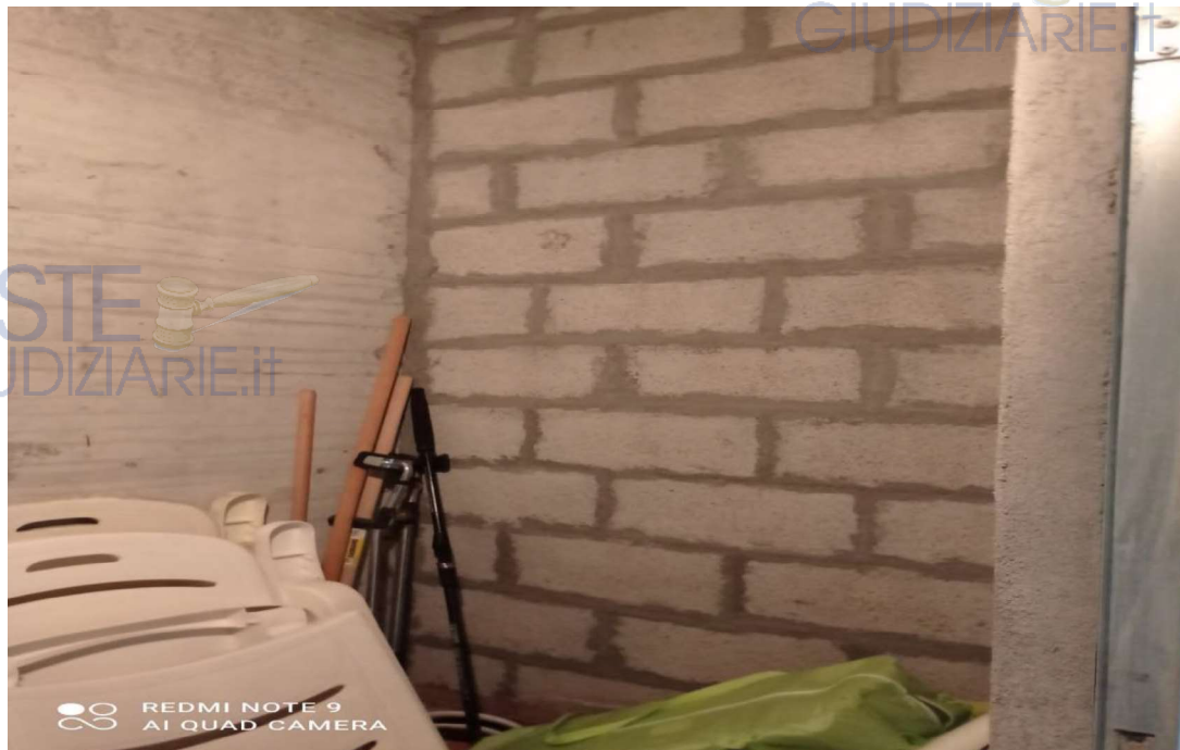
Vista Ambiente Cantina (Piano Interrato)