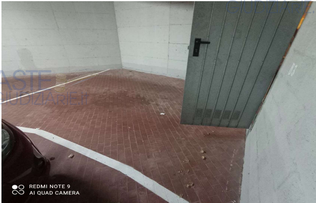
Vista Posto auto (coperto)