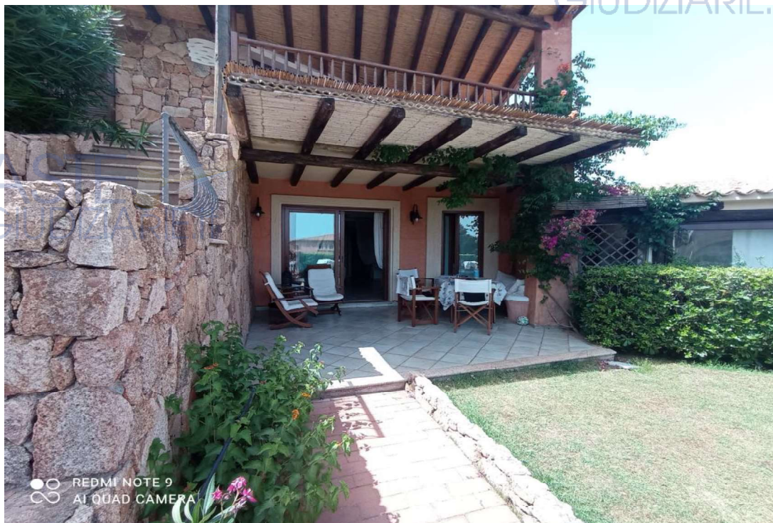
Vista Veranda su prospetto principale