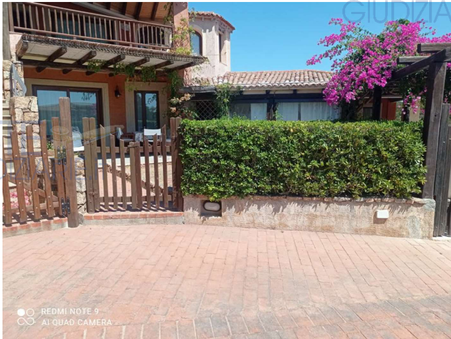
Vista Prospetto Principale