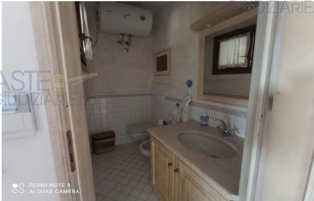
Vista Ambiente servizio igienico (zona Notte)