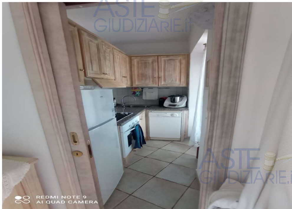
Vista Ambiente Cucinino