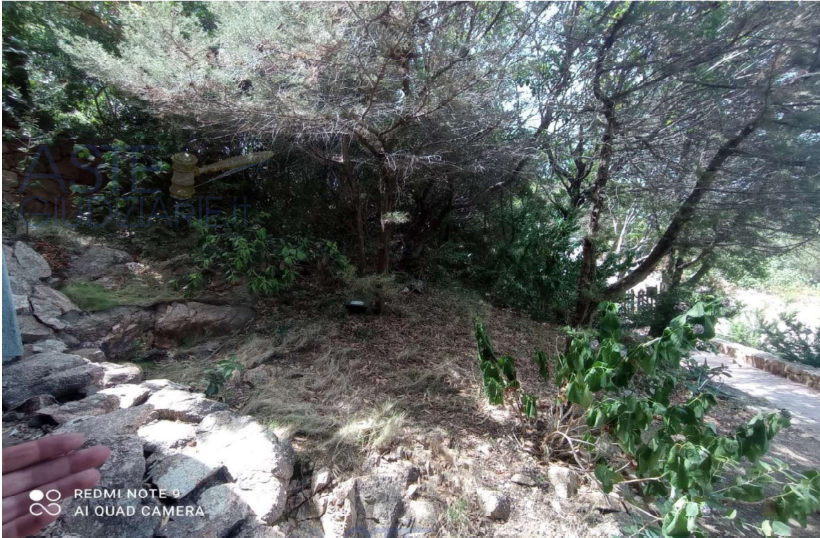
Vista giardino su prospetto posteriore