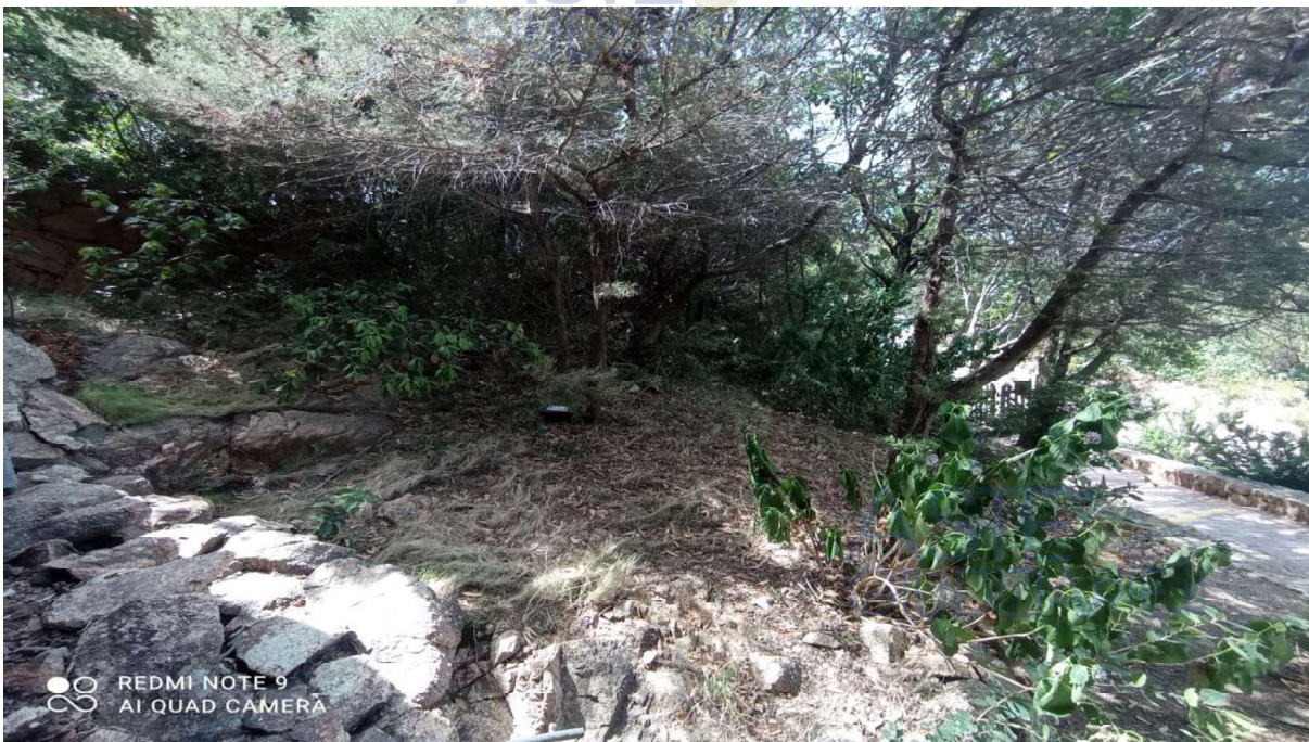
Vista giardino su prospetto posteriore