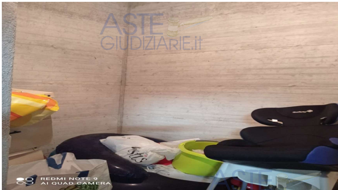
Vista Ambiente Cantina (Piano Interrato)