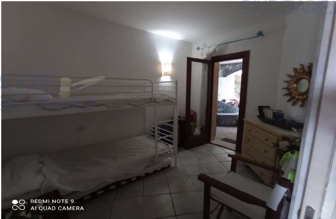
Vista Ambiente Camera da letto singola