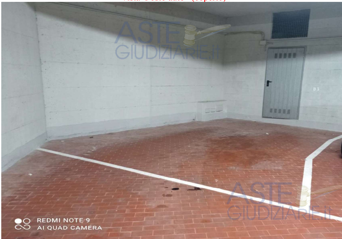
Vista Posto auto (coperto)