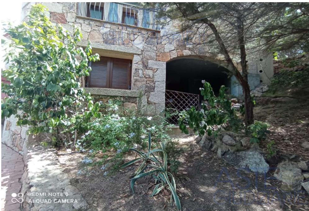
Vista Prospetto posteriore