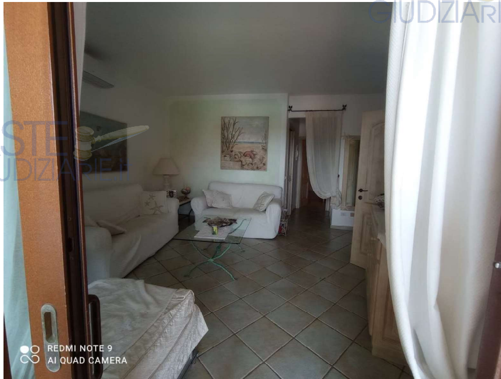
Vista Ambiente Soggiorno