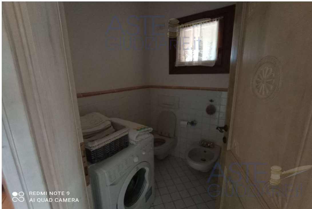
Vista Ambiente servizio igienico (zona Giorno)