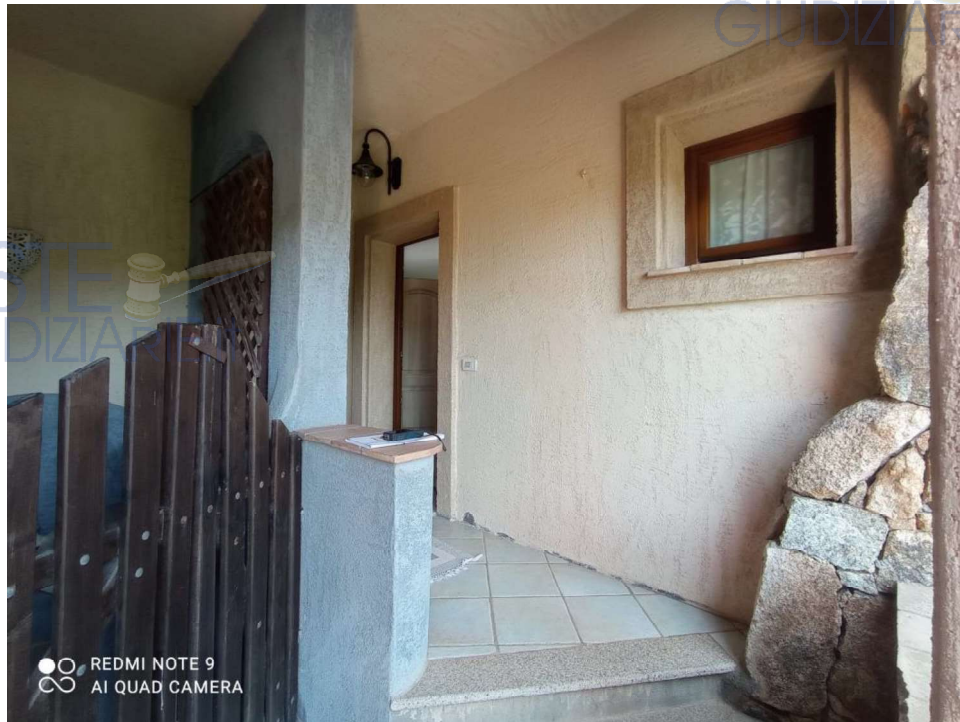
Vista Prospetto laterale ingresso