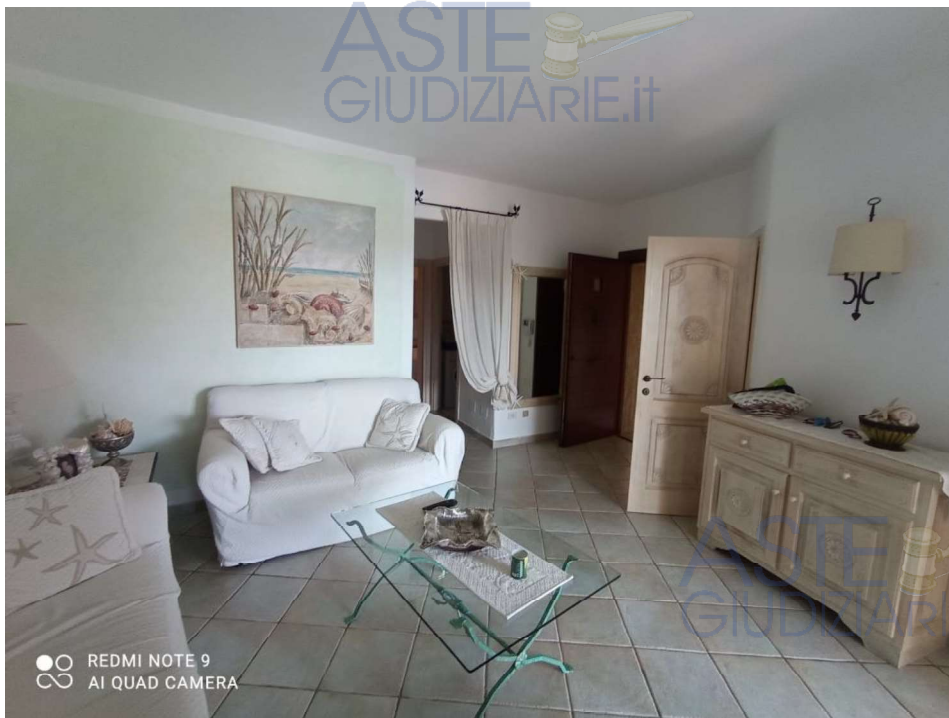
Vista Ambiente Soggiorno