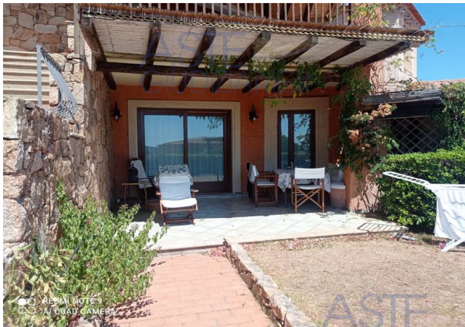
Vista Prospetto Principale